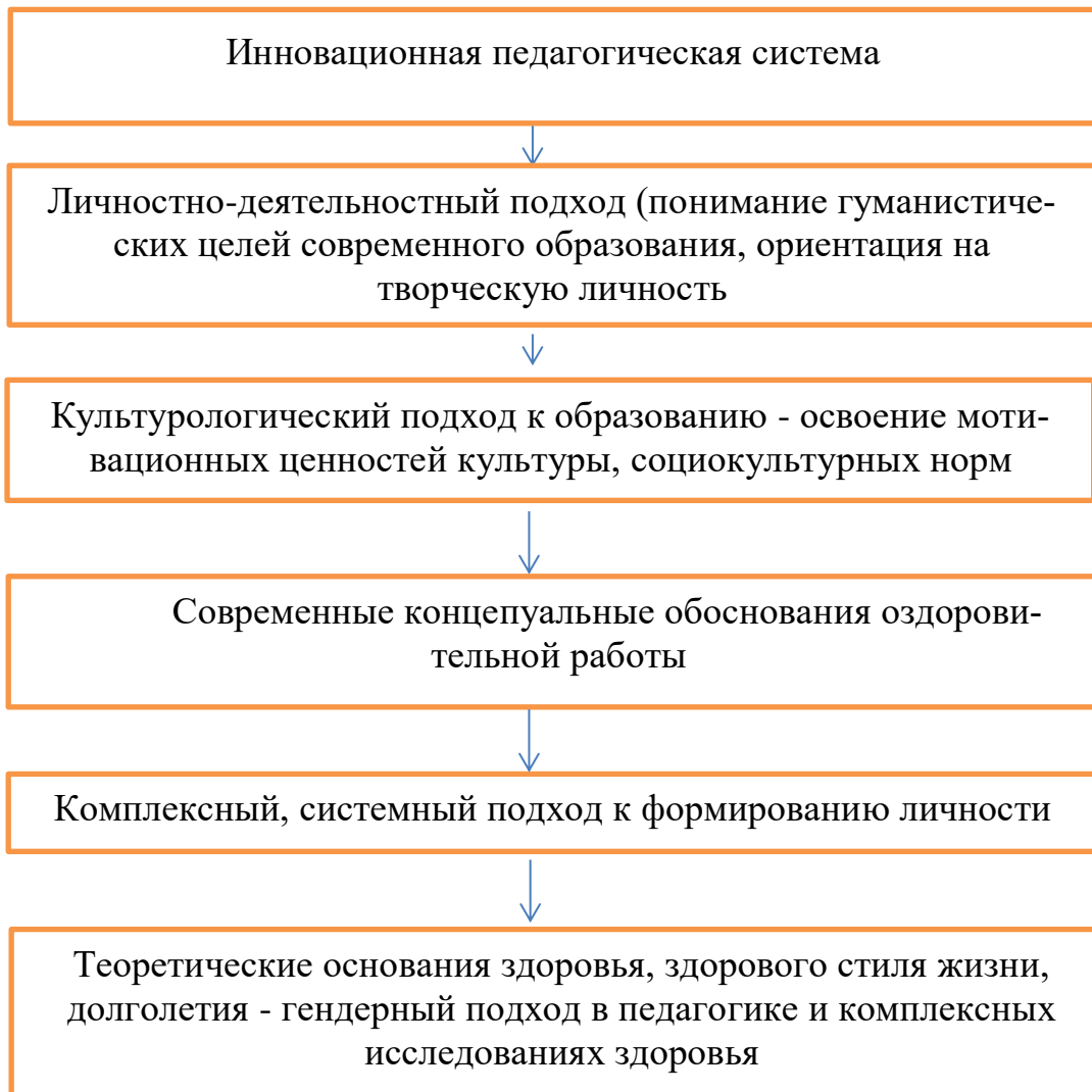
Рисунок 2 – Иновационная педагогическая модель в системе образования

Современные научные обоснования оздоровительной работы и гендерный подход в педагогике сопряжен с комплексными исследованиями здоровья (А.Н. Дахин, И.Е. Калабихина, Р.М. Масагитов, Н.А. Шведова).