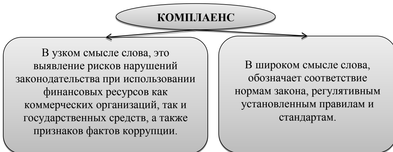
Рис.1. Сущность категории "комплаенс"

Понятие «комплаенс» можно рассматривать как в узком, так и в широком смысле (рис. 1).