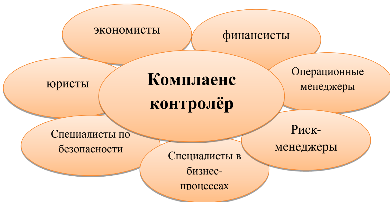
Рис. 2. Участники системы комплаенс