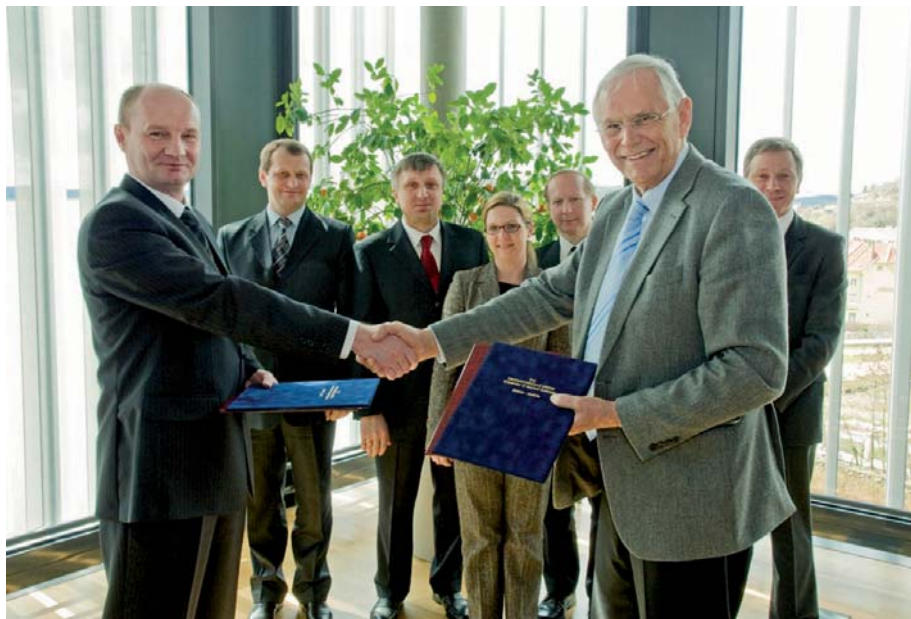
Подписание соглашения о сотрудничестве между Полесским государственным университетом и Университетом прикладных наук в г. Кремс (Австрия)

ного комплекса. Роль Полесского государственного университета для данного региона должна стать определяющей. Перед созданным учебным заведением были поставлены следующие стратегические задачи: обеспечить национальную финансовую систему высокопрофессиональными кадрами и научную составляющую для вывода белорусского Полесья на новый, более высокий уровень социально-экономического развития.