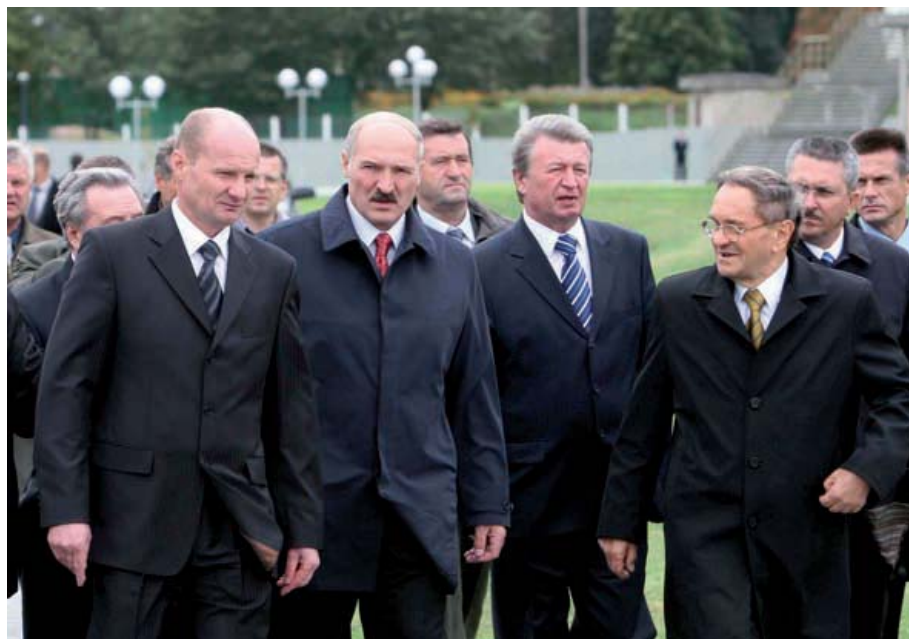
Посещение Полесского государственного университета Президентом Республики Беларусь А. Г. Лукашенко