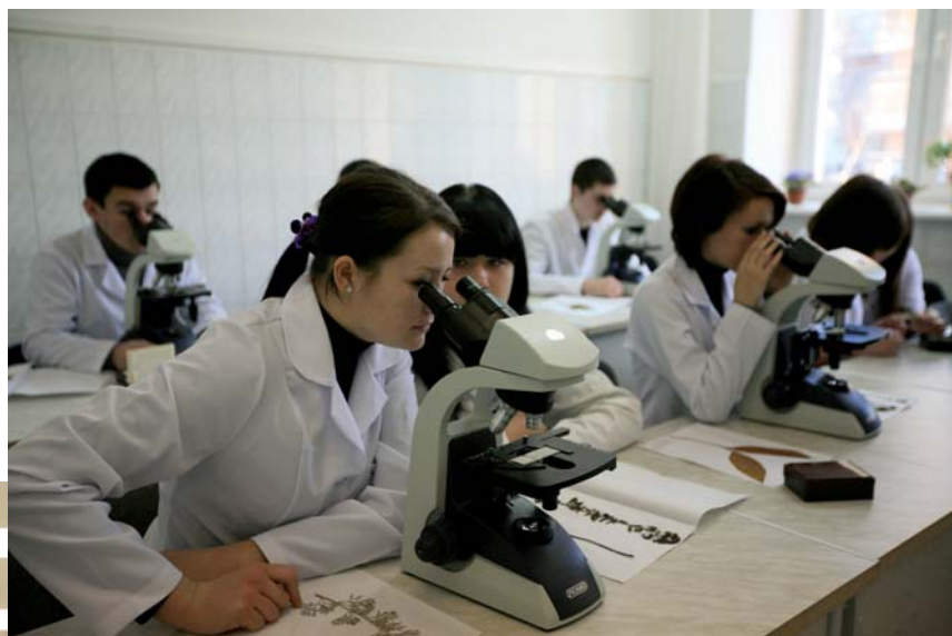
В лаборатории биотехнологического факультета

Сегодня факультет осуществляет подготовку студентов дневной и заочной форм обучения с полным и сокращенным сроками обучения по следующим специальностям и специализациям: