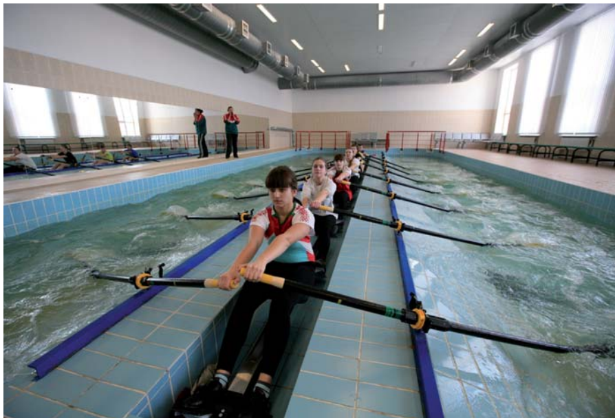
Занятия по физической культуре на гребной базе ПГУ