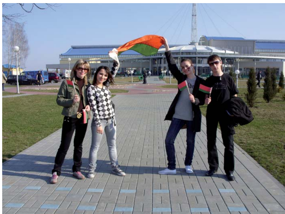
За сильную и процветающую Беларусь

Созданный на базе Пинского филиала Белорусского государственного экономического университета экономический факультет