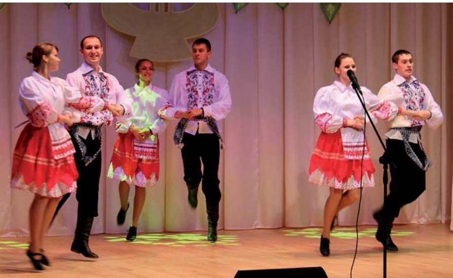
Народный ансамбль эстрадного танца «Альянс»

осуществляет подготовку студентов по следующим специальностям и специализациям: