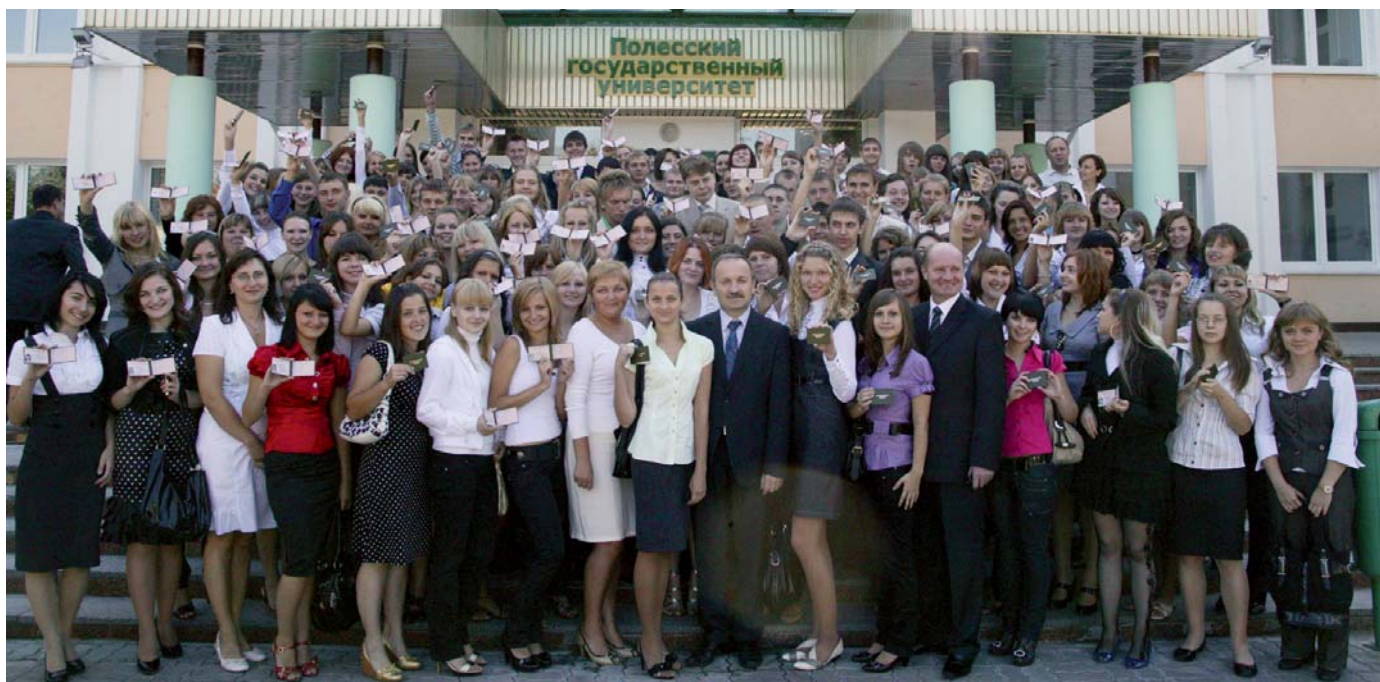
День знаний в университете

Пять лет назад, открывая высшее учебное заведение в Пинске, Президент Республики Беларусь А. Г. Лукашенко подчеркнул, что Полесский регион имеет мощный потенциал, который в кратчайшие сроки необходимо максимально задействовать для повышения эффективности народно-хозяйствен-