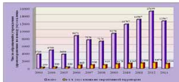
Рисунок 1 – Динамика обращаемости населения в учреждения здравоохранения г. Минска по поводу укуса клеща за период 2003-2013 гг.

Следует подчеркнуть, однако, что заболеваемость ЛБ в мегаполисах значительно выше, чем в целом по республике. Как видно из представленных в таблице 1 данных, за указанный период показатель заболеваемости на 100 тыс. населения были выше, чем по стране, в среднем, в 1,3-2,0 раза. В возрастной структуре горожан, заболевших клещевыми инфекциями, взрослые составляли до 95%, среди них преобладали служащие (до 35-40%), пенсионеры (20-25%), рабочие (15-20%), которые наиболее часто посещали лесные массивы с