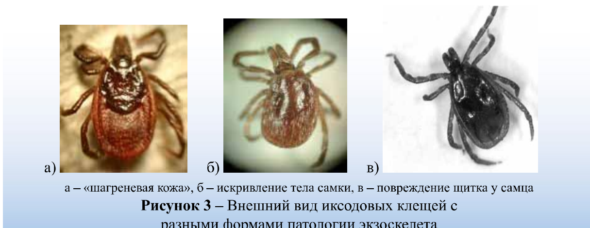
Таблица 4 – Численность аномальных особей в сборах I. ricinus , собранных на территориях с разным содержанием Cd