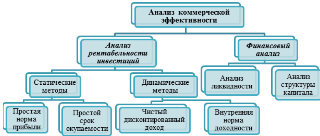
Рис. 2. Структура анализа коммерческой эффективности в соответствии с Руководством UNIDO

В соответствии с Руководством «анализ коммерческой эффективности – это первый шаг в экономической оценке проекта. Он связан с оценкой возможности реализации нового проекта с точки зрения его финансовых результатов. Прямые доходы и затраты проекта, таким образом, рассчитываются в денежном (стоимостном) выражении по преобладающим (ожидаемым) рыночным ценам» [4, с. 37]. Данный вид анализа используется для оценки надежности и приемлемости как одного проекта, так и ряда проектов с целью их ранжирования исходя из доходности. Анализ коммерческой эффективности состоит из анализа рентабельности инвестиций и финансового анализа.