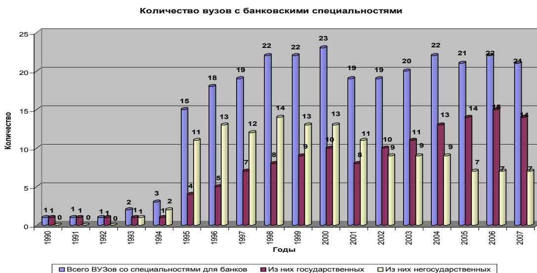
Рисунок 2 – Количество высших учебных заведений с банковскими специальностями

В целом же доля негосударственных вузов достигала наибольшей величины - 63 % - в 1995 и 1996 годах. В последние годы она составляет приблизительно 32-33 % от общего числа банковских вузов.