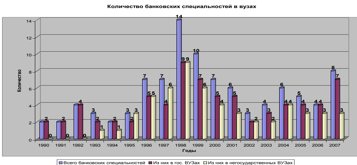
Рисунок 3 – Количество банковских специальностей, предлагаемых вузами

Диапазон специальностей также в рассматриваемый период сильно варьировался. Среди высших учебных заведений банковского профиля разнообразие специальностей подверглось заметным колебаниям независимо от формы собственности. Скорее всего, это связано с постоянным поиском учебными заведениями оптимального соотношения спроса кредитных учреждений и абитуриентов на определённые специальности, и своими возможностями предлагать наиболее конкурентоспособную, материально и технически обеспеченную для них базу. Так, среди негосударственных вузов начиная с 1994 года по 1998 наблюдался рост количества банковских специальностей, после чего произошёл заметный спад и, в последние годы, относительная стабилизация (Рисунок 3).