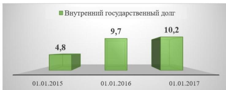
Рисунок 2 – Динамика внутреннего государственного долга Республики Беларусь на 01.01.2015-01.01.2017 гг., млрд. руб.

На рисунке 2 представлена динамика внутреннего государственного долга на 01.01.2015-01.01.2017 гг.