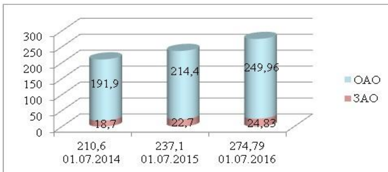
Рис 2. Динамика объемов выпуска акций акционерных обществ в Республике Беларусь за период 2014-2016 гг. (трлн. неденоминир. рублей)

Суммарный объем торгов акциями в I полугодии 2016 г. по сравнению с I полугодием 2015 г. составил 95,5 млрд. неденоминир. руб. или 3 001 586 акций. При этом за данный период времени сделок купли-продажи с акциями ОАО было заключено на 84,7 млрд. неденоминир. белорусских руб., в долларах США – на 200 000 долларов США, а в российских рублях – на 22 748 080 российских рублей.