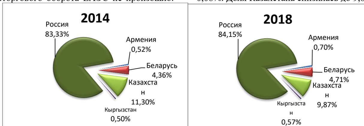
Рисунок 1 – Структура внешнеторгового оборота ЕАЭС

Доля России во внешней торговле ЕАЭС в 2018 г. возросла на 0,82% по сравнению с 2014 г., доля Беларуси на 0,35%, доля Армении на 0,18%, доля Кыргызстана на 0,08%. Доля Казахстана снизилась до 9,87%.