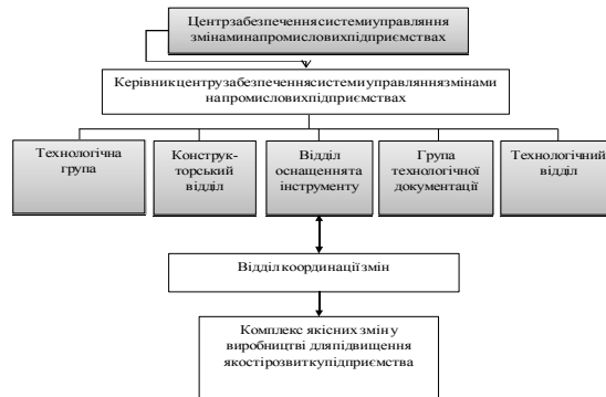
Рис. 2. Організаційна схема центру забезпечення системи управління змінами у виробництві на промислових підприємствах (розробка авторів)

Організаційну схему центру забезпечення системи управління змінами у виробництві на промислових підприємствах подано на рис. 2.