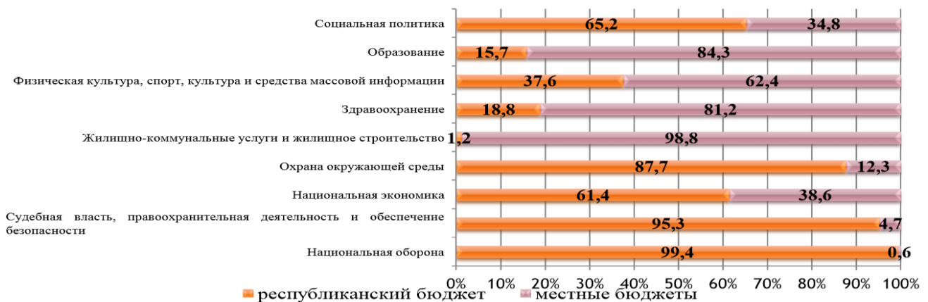
Структура расходов консолидированного бюджета в разрезе бюджетов в 2018 году по функциональной классификации (в процентах)

Наибольший удельный вес доходов в республиканский бюджет занимают акцизы и налоги от внешней экономической деятельности, что объясняется внешнеторговыми отношениями страны. В местных бюджетах наибольшую часть занимают поступления по подоходному налогу и налогу на собственность. Это обусловлено обязательностью их уплаты, а также тем, что уплачивается по месту проживания.