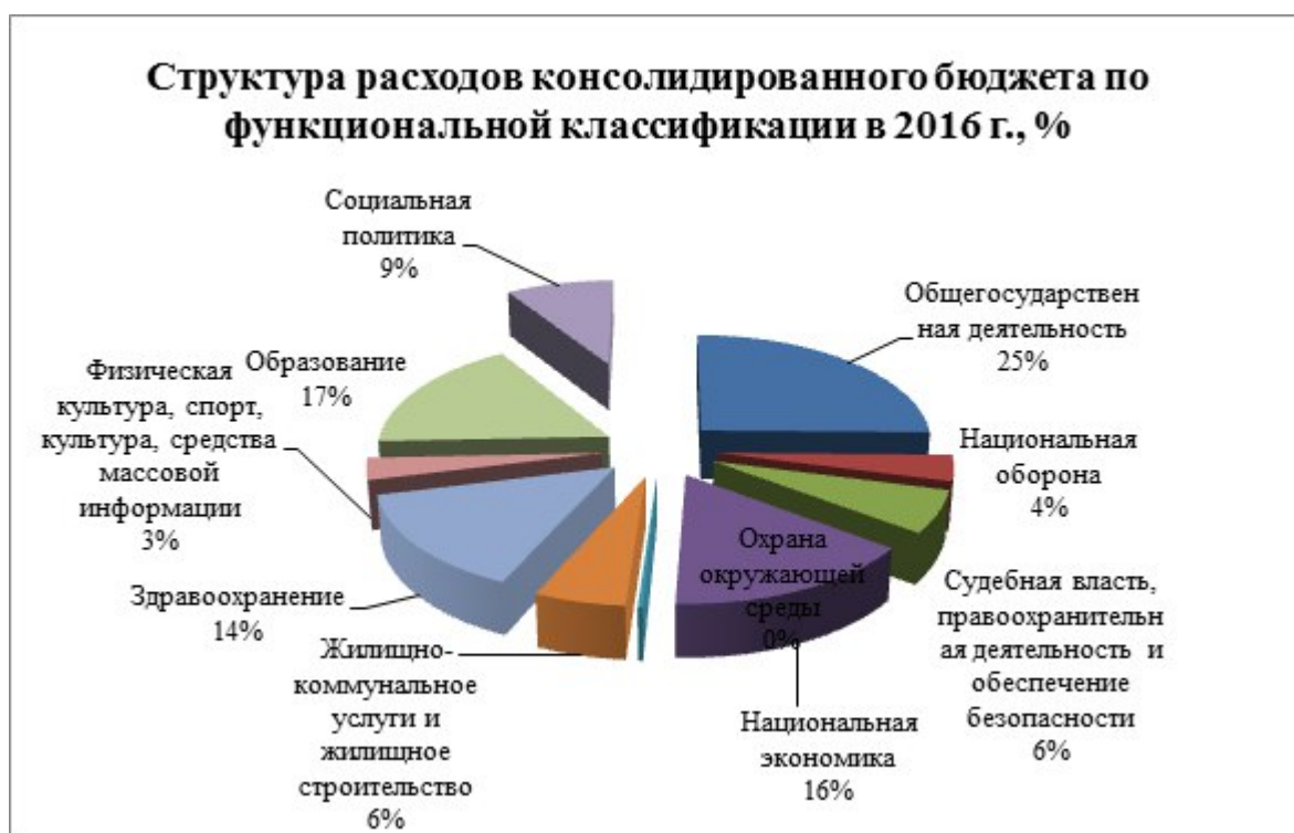
Рисунок 2 – Структура расходов консолидированного бюджета по функциональной классификации в 2016 г., %

Примечание – Источник: Собственная разработка на основании [1]