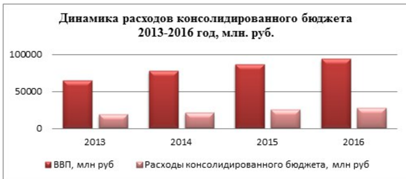
Рисунок 1– Динамика расходов консолидированного бюджета 2013-2016 год, млн. руб.

Консолидированный бюджет РБ за 2014 – 2016 год был исполнен с профицитом. В 2016 году его размер составил 1 204,3 млн. руб., или 1,3% к ВВП (за 2015 год – 1 594,5 млн.руб. или 1,8% к ВВП). Сумма профицита государственного бюджета Республики Беларусь сравнима с профицитом бюджета стран .Евросоюза. В Дании этот показатель достиг значения 1,5% ВВП, Люксембурге –1,4%ВВП.[1] С каждым годом наблюдается тенденция увеличения расходов государственного бюджета (рисунок 1) .