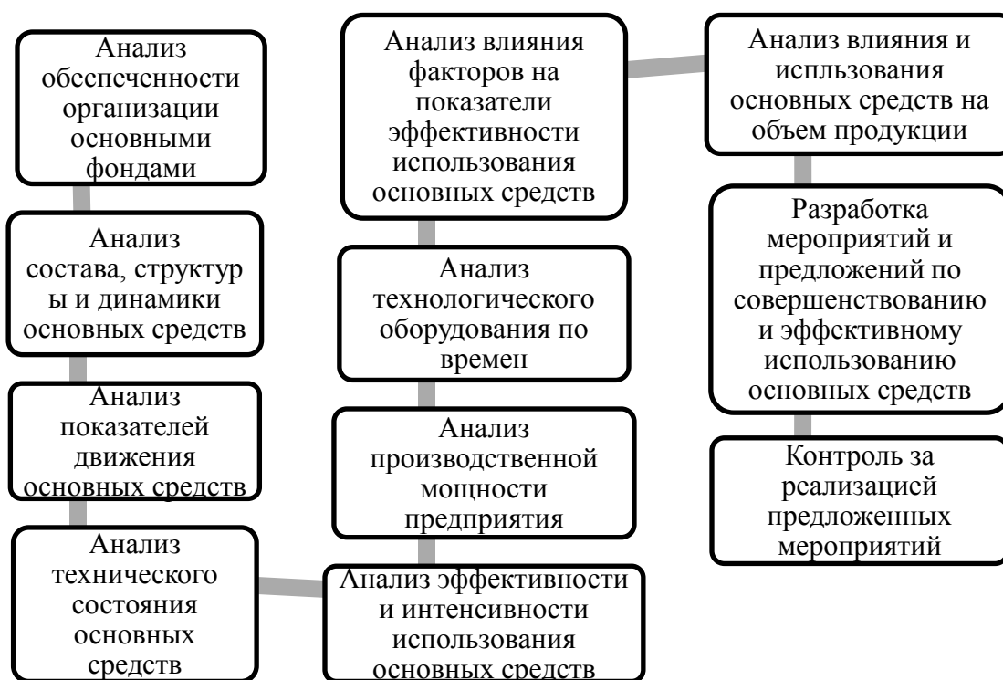
Рис. 2. Алгоритм анализа состояния и эффективности использования основных средств

Сравнив методики анализа основных средств, предложенных выше авторами, мы предлагаем следующий алгоритм анализа эффективности использования основных средств, представленный на рисунке 2.