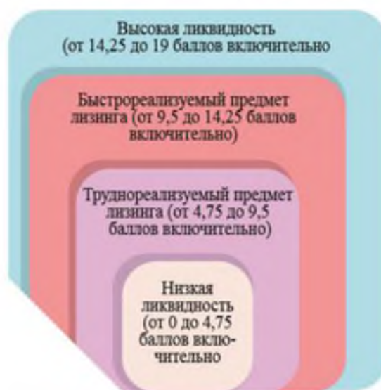
Рисунок 3. – Разграничение степеней ликвидности предметов лизинга по результатам проведенного анализа

В предлагаемой методике оценки ликвидности предмета лизинга используется условная шкала баллов, которую можно, при необходимости, заменить на другую, что, соответственно, результат проведения анализа не изменит (при условии соблюдения пропорциональности).