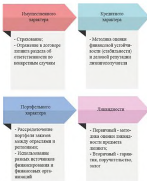
Рисунок 4. – Способы минимизации специфической группы рисков лизинговой сделки

При проставлении всех баллов и их суммировании можно сделать обоснованный вывод о ликвидности предмета лизинга (рисунок 3).