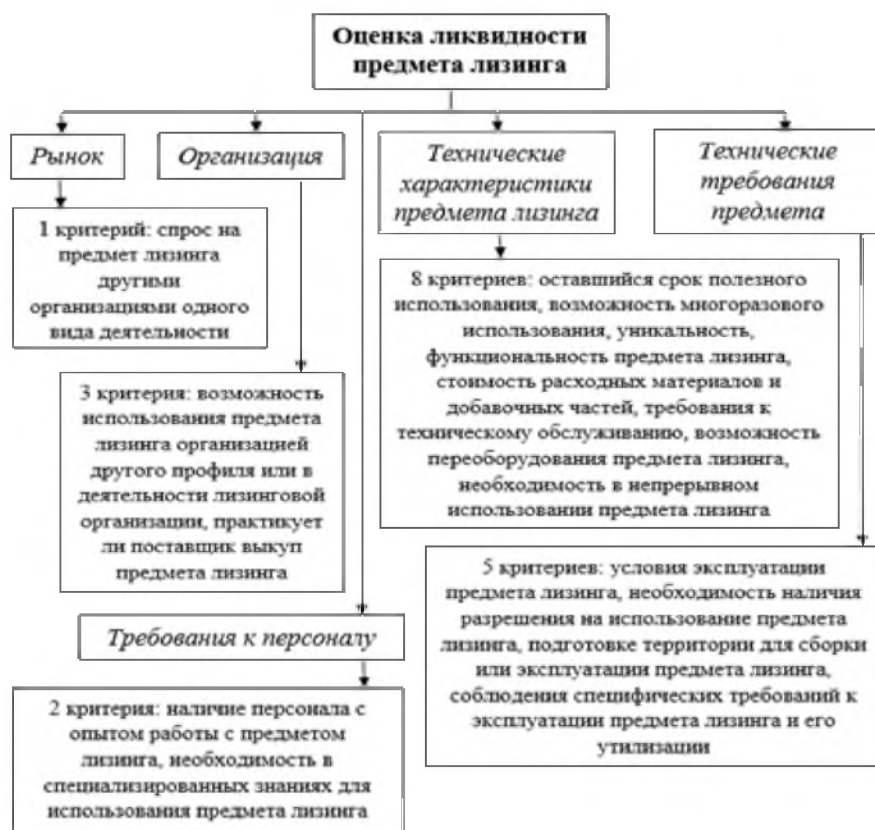
Рисунок 2. – Методика оценки ликвидности предмета лизинга

К каждому критерию были выделены группы (от 2 до 4) и подгруппы, где целесообразно (от 0 до 6). К каждой группе (подгруппе) необходимо проставить баллы (от 0 до 1), где наименьшее значение будет иметь предмет лизинга с наименьшей ликвидностью, а наибольшее – предмет лизинга, который возможно реализовать относительно быстрее остальных предметов лизинга. Как и все показатели ликвидности, ликвидность предмета лизинга оценивается на определенный момент или короткий период, что не дает объективной и полной уверенности в оправдании ожиданий.