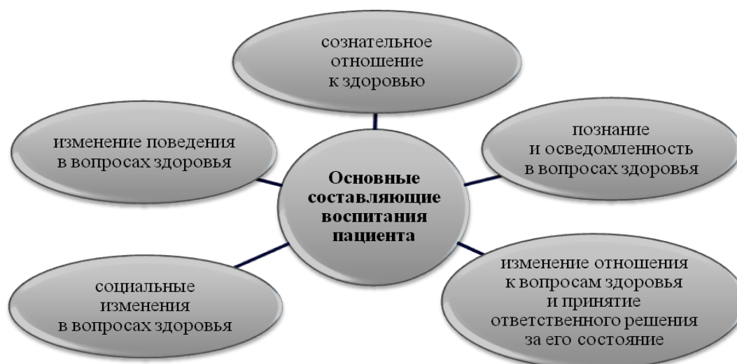
Рисунок 1 – Схема содержания воспитания в профессиональной деятельности медицинского работника

Схема содержания воспитания в профессиональной деятельности медицинского работника представлена на рисунке 1.