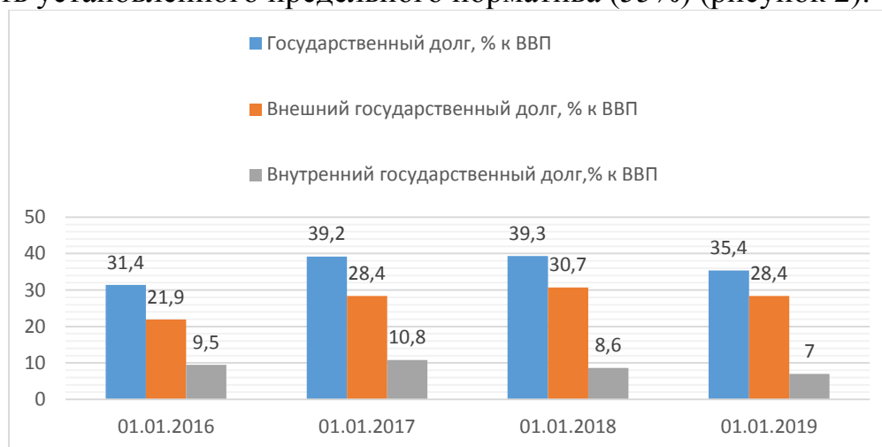
Рисунок 2 – Динамика отношения объема государственного долга к ВВП за период 01.01.2016 — 01.01.2019 гг., %

Рассмотрим показатель отношения государственного долга к уровню ВВП за период 01.01.2016 — 01.01.2019 гг., который позволяет оценить уровень долговой нагрузки на экономику страны. Данный показатель не должен превышать установленного предельного норматива (55%) (рисунок 2).