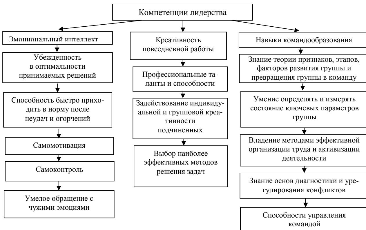
Рисунок 2 – Компетенции лидерства в мотивационном аспекте инновационного менеджмента организации

Как отмечают Полозова А.Н. и Григорьева В.В., экономическая природа конкурентостойчивых издержек производства во многом характеризуется соотношением мотивированных усилий и полученных результатов [4; 5; 7; 8].