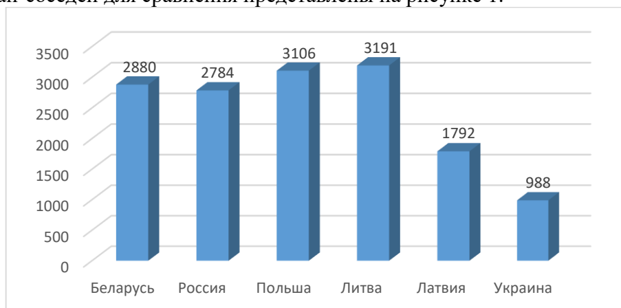
Рис. 1. Численность человек, занятых в сфере исследований и разработок.

Не смотря на совокупность отрицательной динамики, Республика Беларусь характеризуется некоторыми положительными тенденциями по сравнению с другими странами. По данным Национального статистического комитета, в Беларуси в сфере научных исследований и разработок в 2018 году было занято 27,4 тыс. человек (0,6% от общей численности работающих в организациях страны). Таким образом, в Беларуси на 1 миллион населения приходится около 2880 человек, занятых в сфере исследований и разработок. Данные Республики Беларусь, а также показатели, согласно Мировому атласу данных, ближайших стран-соседей для сравнения представлены на рисунке 1.