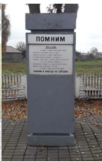
Рисунок 3. – Памятник евреям Лахвы, восставшим в гетто