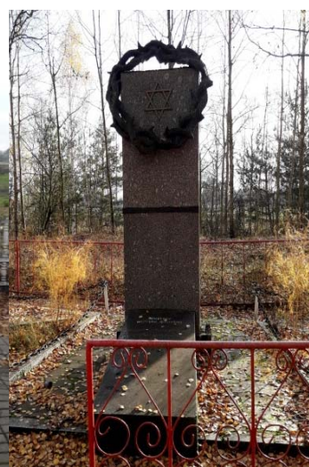
Рисунок 4. – Памятник евреям Лахвы, убитым 3 сентября 1942 г.

Таким образом, на территории белорусского Полесья тысячи евреев приняли активное участие в партизанском движении. Они являлись не только рядовыми, но также организаторами и руководителями партизанского движения. Вместе с другими участвовали в боевых операциях, диверсиях, собирали разведывательную информацию, были связными, врачами. Кто не был способен носить оружие, работал в сапожных, портняжных, оружейных мастерских, ухаживал за ранеными.