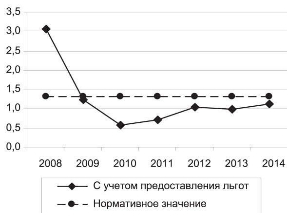
Рис. 2. Значения коэффициента покрытия задолженности по проекту за 2008–2015 гг.

К предприятию, реализующему инвестиционный проект, предъявлялись требова-