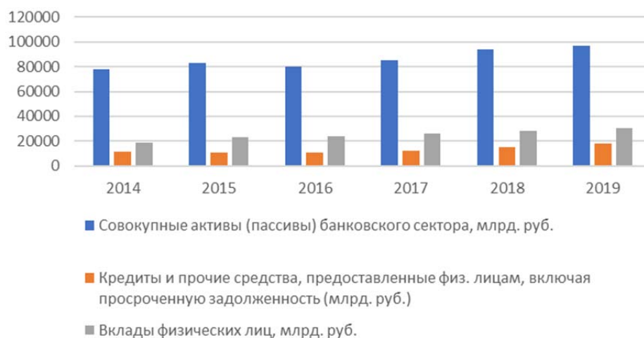
Рисунок 1. – Динамика показателей банковского сектора 2014-2019 гг., млрд. руб.

Рассматриваемый период развития банковского сектора в целом характеризуется стабильностью качества активов и восстановлением базового уровня рентабельности (табл. 2).