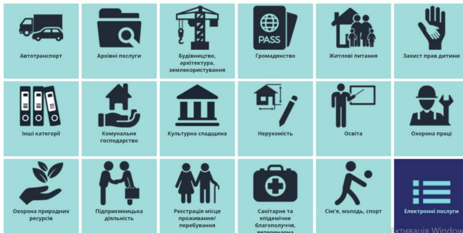
Рисунок 1. – Перелік послуг (спектр послуг), які надають ЦНАП України

У процесі реалізації децентралізаційної реформи, відмічено значні успіхи щодо діяльності ЦНАП України. Зокрема, децентралізація сформувала сприятливі економічні умови. Адже вони сприяють наповненню місцевих бюджетів (рис. 2). Впродовж 2014-2019 рр. їх обсяги збільшилися більше, ніж утричі (з 68,6 млрд грн. до 250,5 млрд грн. відповідно). Створено понад 1470 ОТГ в державі. Середнє число жителів у ОТГ становить близько 11,4 тис. осіб. На разі в Україні вже функціонують близько 1 тис. ОТГ.