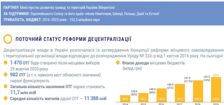
Рисунок 2. – Позитивні результати децентралізації й розвитку ЦНАП в межах ОТГ

У процесі реалізації децентралізаційної реформи, відмічено значні успіхи щодо діяльності ЦНАП України. Зокрема, децентралізація сформувала сприятливі економічні умови. Адже вони сприяють наповненню місцевих бюджетів (рис. 2). Впродовж 2014-2019 рр. їх обсяги збільшилися більше, ніж утричі (з 68,6 млрд грн. до 250,5 млрд грн. відповідно). Створено понад 1470 ОТГ в державі. Середнє число жителів у ОТГ становить близько 11,4 тис. осіб. На разі в Україні вже функціонують близько 1 тис. ОТГ.