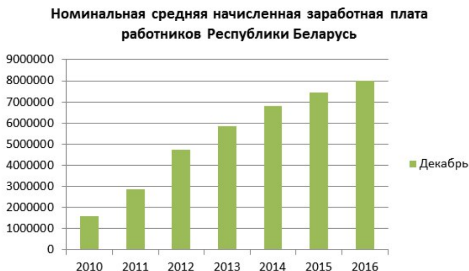
Рисунок 3. Номинальная средняя начисленная заработная плата работников Республики Беларусь за декабрь тыс.руб.

Проанализировав данные о номинальной средней начисленной заработной плате работников РБ за декабрь, составили график (рисунок 3).