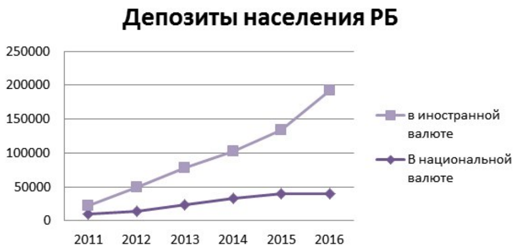
Рисунок 4. Депозиты населения Республики Беларусь

Процесс сберегательной активности населения Беларуси характеризуется тенденцией роста денежных сбережений, что непосредственно связано с высокими темпами развития экономики и ростом благосостояния населения в последние годы. Рассмотрим депозиты населения РБ (рисунок 4).