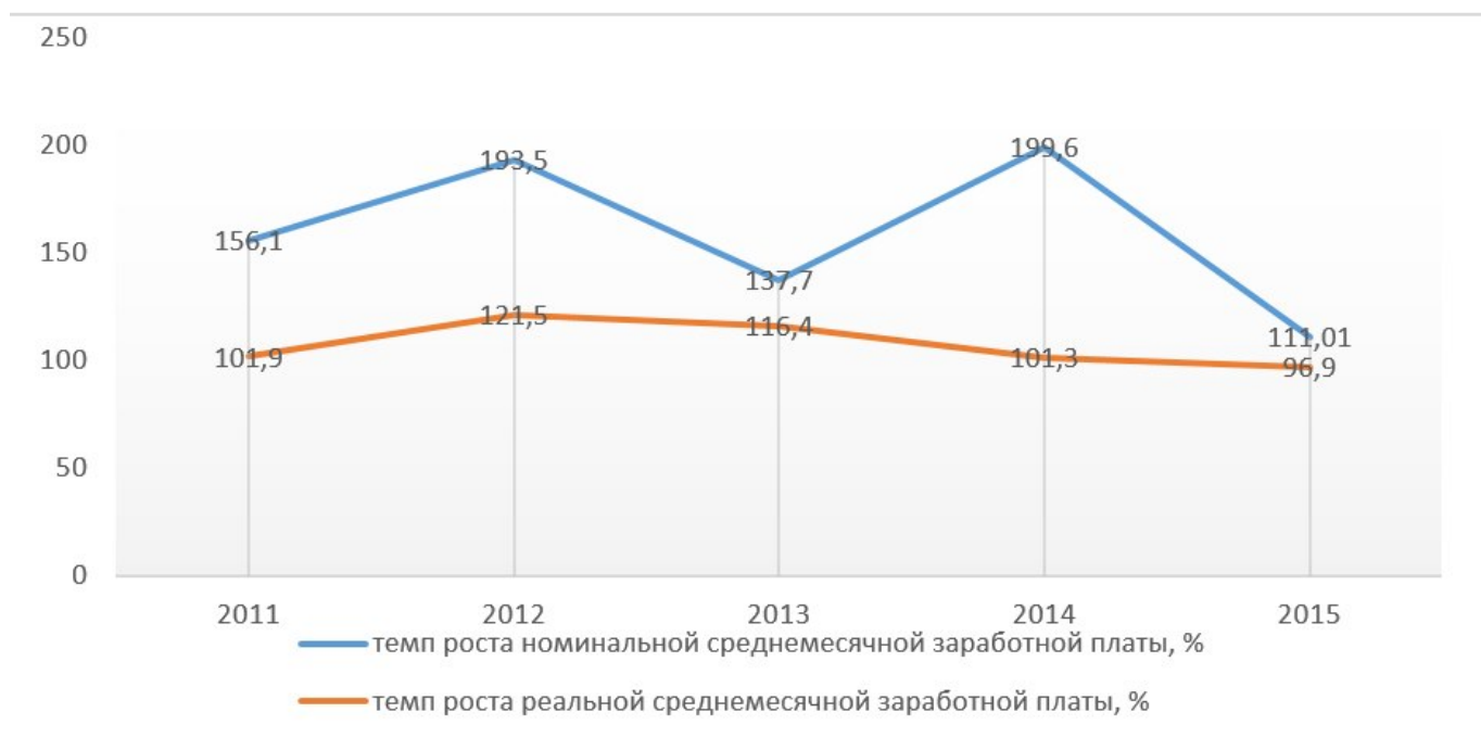
Рисунок 1.1- Динамика цепных темпов роста номинальной и реальной среднемесячной заработной платы населения Республики Беларусь в 2011 – 2015 гг., %.

Рассмотрим только один источник материального благосостояния населения - средняя заработная плата (рисунок 1.1).