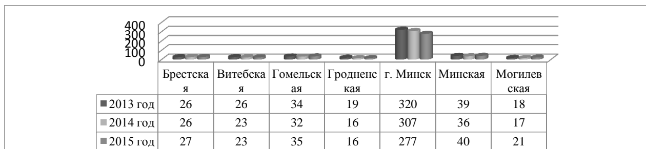
Рисунок 1 – Число организаций, выполнявших исследования и разработки

Развитие научного потенциала во многом зависит и от количества организаций, осуществляющих научные исследования и разработки. По данному показателю наблюдается также тенденция снижения — сокращение с каждым годом числа таких организаций. Так, в 2015 г. их количество составило 439, в 2014 г. — 457, в 2013 г. — 482 организации. Число организаций, выполнявших научные исследования и разработкам по областям и г. Минску представлено на рисунке 1.