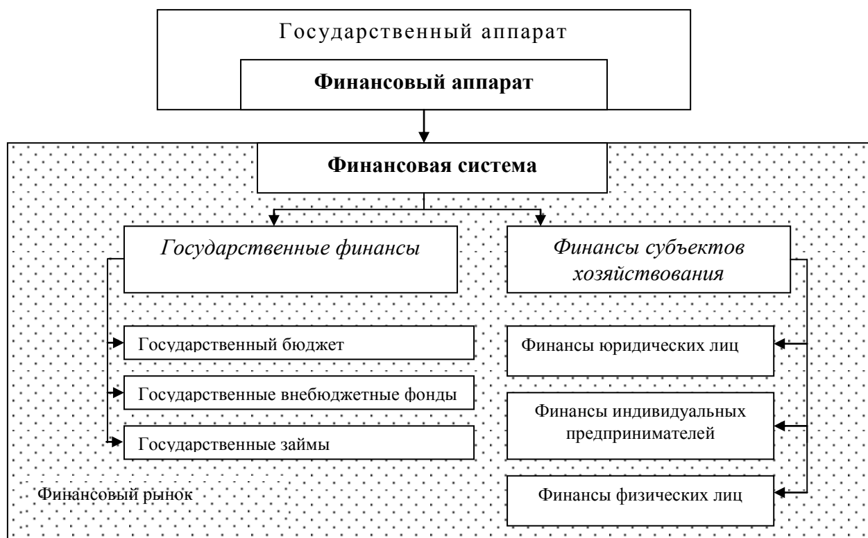
Рис. 1. Финансовая система государства

На наш взгляд, финансы субъектов хозяйствования возможно подразделить на финансы юридических лиц (коммерческие и некоммерческие), финансы индивидуальных предпринимателей и финансы физических лиц. Такая классификация звеньев финансовой системы оправдана применением налогового законодательства и полностью ему соответствует, а также акцентирует внимание, повышает роль и значение индивидуальных предпринимателей и физических лиц в финансовой системе государства. Авторское видение финансовой системы государства представлено на рисунке 1.