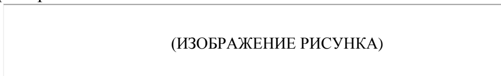
Рисунок 2.1. – Структура затрат на производство продукции

Цифровой материал курсовой работы оформляют в виде таблиц. Каждая таблица должна иметь краткий заголовок, который состоит из слова "Таблица", ее порядкового номера и названия, отделенного от номера знаком тире. Заголовок следует помещать над таблицей слева, без абзачного отступа. Заголовок таблицы печатают обычным шрифтом размером 12 пунктов. Номер таблицы должен состоять из номера главы и порядкового номера таблицы, разделенных точкой.