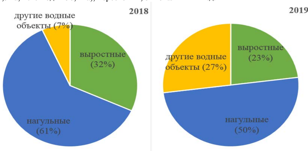
Рисунок 1. – Использование производственных мощностей водных объектов для аквакультуры по категориям прудов

По анализу последних лет (см. рис. 1) можно увидеть, что в 2019 году выростных и нагульных прудов стало меньше, но стало больше других водных объектов, а именно: маточных (2018 год 525,3 га, 2019 год 1456,1 га), нерестовых, зимовальных и т.д.