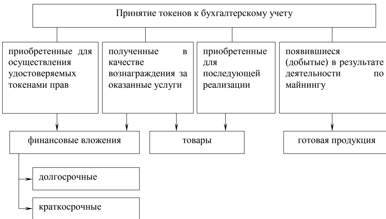
Рис. 1. Принятие токенов к бухгалтерскому учету

В процессе изучения операций с токенами необходимо установить соблюдение требований законодательства по признанию их в бухгалтерском учете (рис. 1).