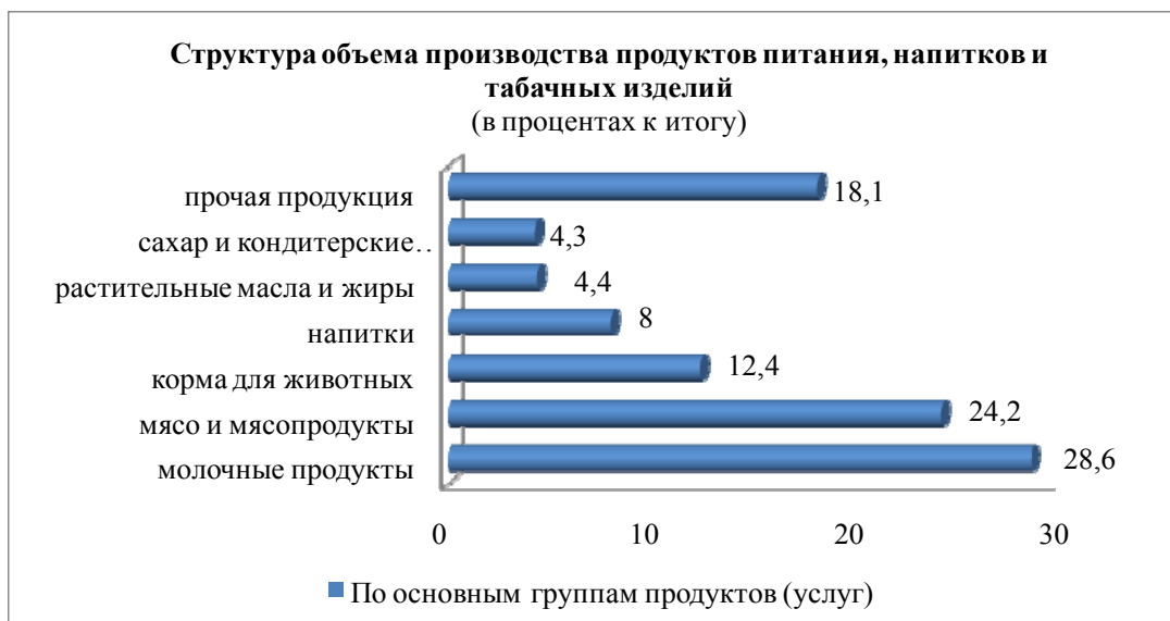
Рисунок 2. – Структура объема производства продуктов питания, напитков и табачных изделий

Примечание – Разработка автора на основании данных источника [3, с. 22]