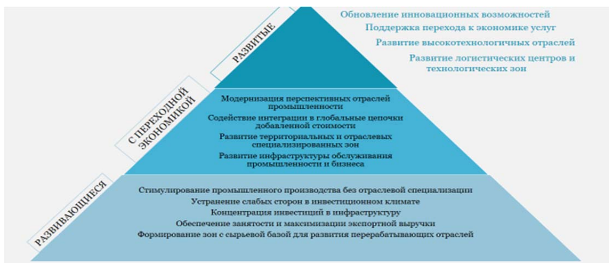
Рисунок 1. – Пирамида целей развития особых экономических зон

Опыт растущих ОЭЗ развивающихся стран показывает, что они ограничиваются деятельностью в отраслях с низкой добавленной стоимостью и не ориентированы на высокие технологии. Несмотря на усилия этих стран по диверсификации, большинство предприятий в зонах занимаются трудоемкими видами деятельности, такими как производство одежды, текстиля, электрических и электронных товаров. Степень товарной специализации, как правило, связана с уровнем промышленного развития принимающей страны, при этом наименее развитые страны обычно принимают у себя неспециализированные зоны с многопрофильным производством [10].