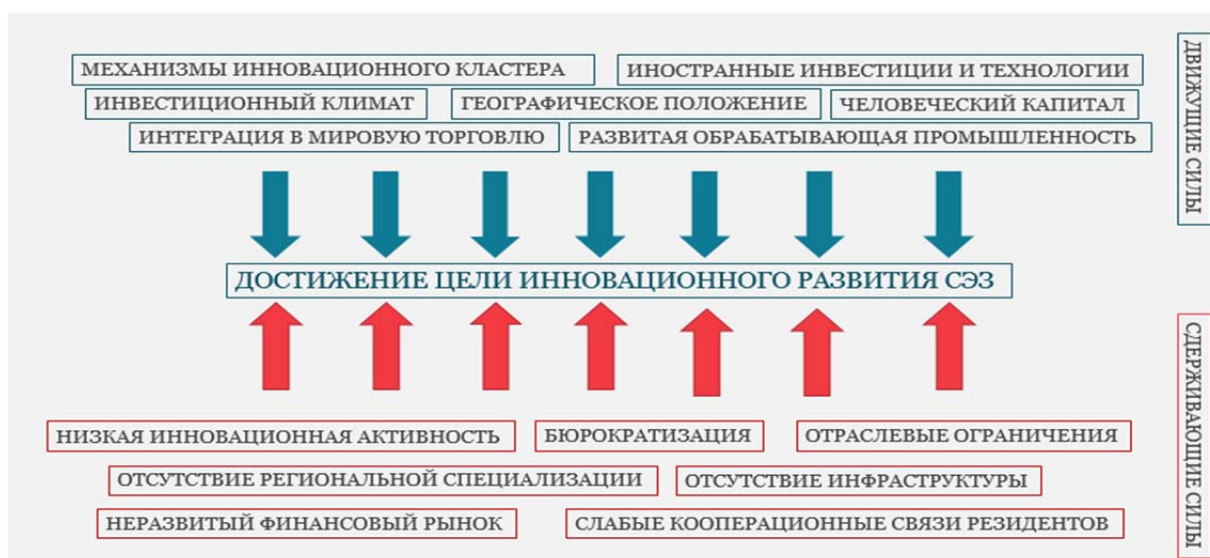
Рисунок 3. – Поле сил активизации инновационного потенциала свободных экономических зон Примечание – Источник: собственная разработка по данным [3]

Препятствуют достижению целей инновационного развития слабые кооперационные связи резидентов, в том числе из-за неразвитого финансового рынка и отсутствия отраслевой специализации, низкая инновационная активность резидентов, маркером которой является малая доля инновационной продукции, отраслевые и управленческие ограничения, которые проявляются, в том числе, в отраслевых перекосах и излишней бюрократии, территориальные и инфраструктурные ограничения, вызванные низкой инфраструктурной обеспеченностью.