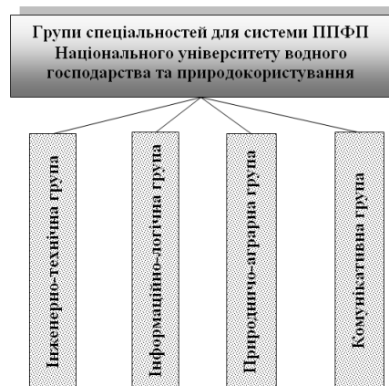
Рис. 2. Групи спеціальностей НУВГП для реалізації професійно-прикладної фізичної підготовки студентів

Групування та класифікація спеціальностей у ВНЗ, їх систематизація забезпечували діагностику професійних інтересів, нахилів, здібностей [4, 110] та включали компоненти, які всебічно характеризують виконану спеціалістом роботу з погляду соціально-економічних, соціально-психологічних, виробничо-технічних, санітарно-гігієнічних, фізіологічних та спеціальних особливостей. Розробка моделей спеціалістів, яким передувало складання комплексних професіограм, була виконана методом педагогічних спостережень за роботою фахівців і приватних емпіричних методів і прийомів (анкетування та опитування, тестування, ранжування). Для точного визначення рівня ППФП (професійно-прикладної фізичної готовності) використовувалися комп'ютерні інформаційні бази даних.