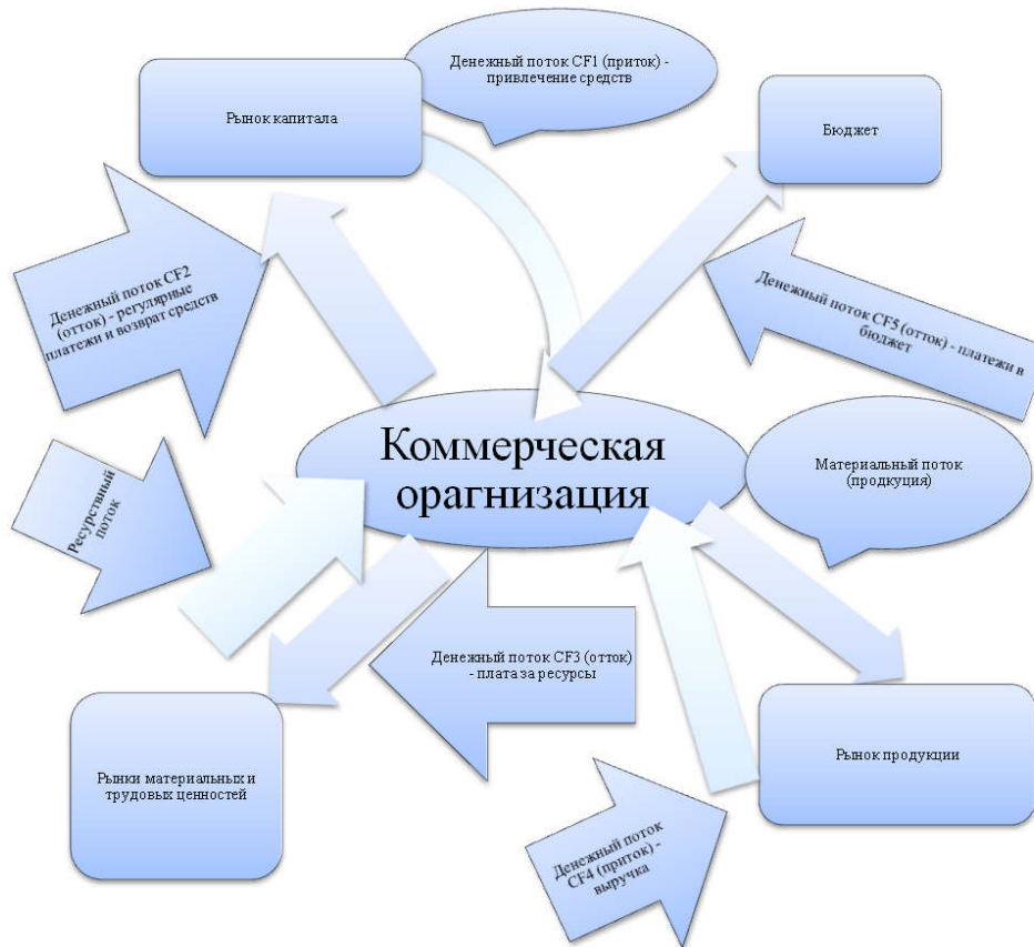
Рисунок 1 – Базовые денежные потоки в контексте деятельности предприятия [5]

– деловая активность и эффективность деятельности предприятия. [12]