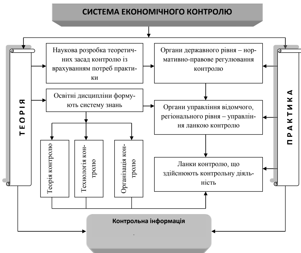
Рисунок 1 – Теоретично-пізнавальна модель системи контролю

взаємообумовлених елементів, що взаємодіють із метою формування контрольної інформації для задоволення потреб користувачів при здійсненні регулювання і прийнятті управлінських рішень.