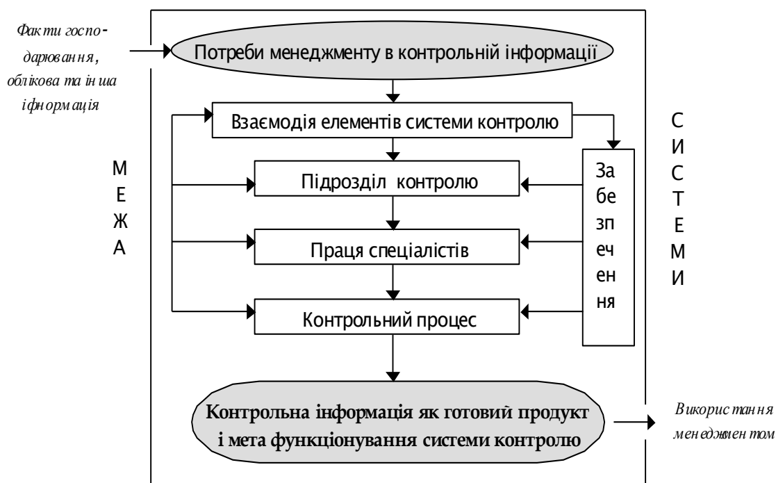
Рисунок 3 – Модель ланки контролю як системи

Вчені не розкрили поняття організації обліку, контролю і аналізу [4]. Поняття організації системи контролю необхідно застосовувати у широкому і вузькому розумінні цього терміну. У широкому розумінні, на наш погляд, – це створення відповідних видів і ланок контролю в державі з метою охоплення контролем всіх сторін економіки і суспільства та регламентація їх функціонування. Важливим в організації системи контролю держави є дотримання вимог, основ-