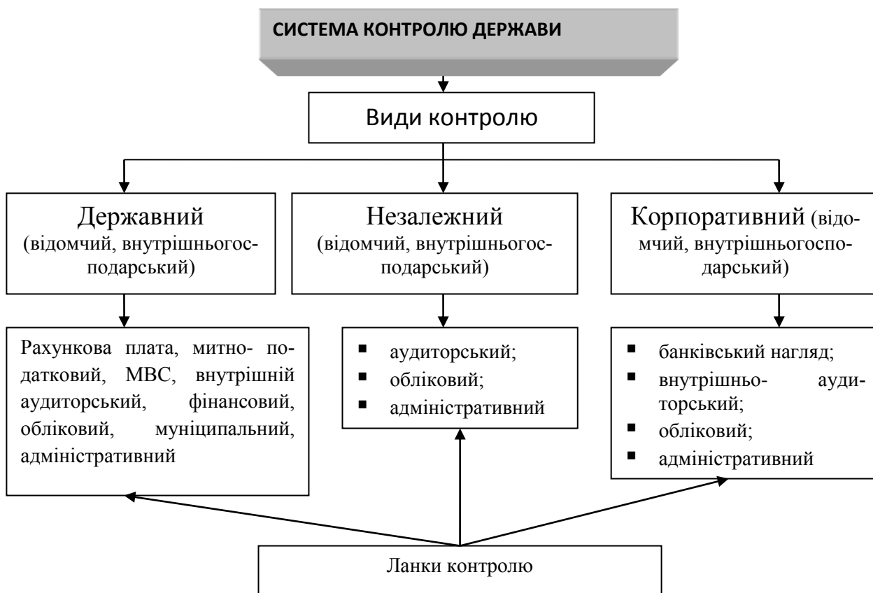
Рисунок 2 – Система контролю держави