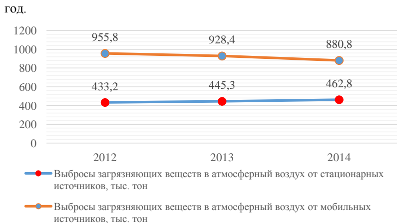
Рис. 1. Выбросы загрязняющих веществ в атмосферный воздух от стационарных и мобильных источников в период с 2012 года по 2014 год, тыс. тонн

В атмосферном воздухе присутствует разнообразный перечень загрязняющих веществ. Преобладают загрязняющие вещества газообразного и жидкого характера. Наибольший удельный вес в структуре загрязнений занимают углеводороды. На их долю приходится 32,2 процента от общего объема загрязнений.