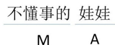
Figure 3. The analysis of 不懂事的娃娃

Russian word «ребенок» is translated into 不懂事的娃娃(4). Actualizer 娃娃 is explained with the modifier 不懂事的.