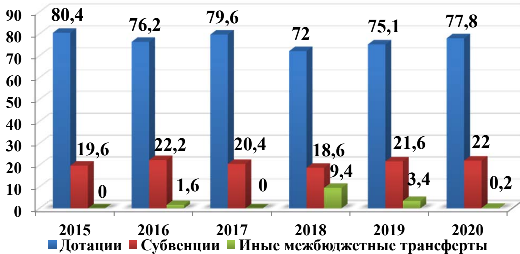
Рисунок 2. – Структура безвозмездных поступлений в консолидированный бюджет Брестской области в период с 2015 по 2020 год, %

На рисунке 2 представлены данные по безвозмездным поступлениям в консолидированный бюджет Брестской области за 2015-2020 годы.