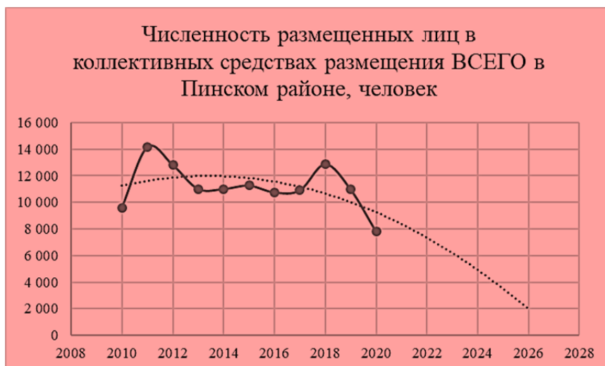
Рисунок 1. – Численность размещенных лиц в коллективных средствах размещения ВСЕГО в Пинском районе, человек

2. Увеличение же спроса на коллективные средства размещения к 2026 году в Столинском, Житковичском, Петриковском, Наровлянском и Мозырском районах обусловлен недостаточно развитой сетью индивидуальных средств размещения и их рекламы, однако коллективные средства размещения также используются при организации экотуристических маршрутов (рисунки 2 – 6).