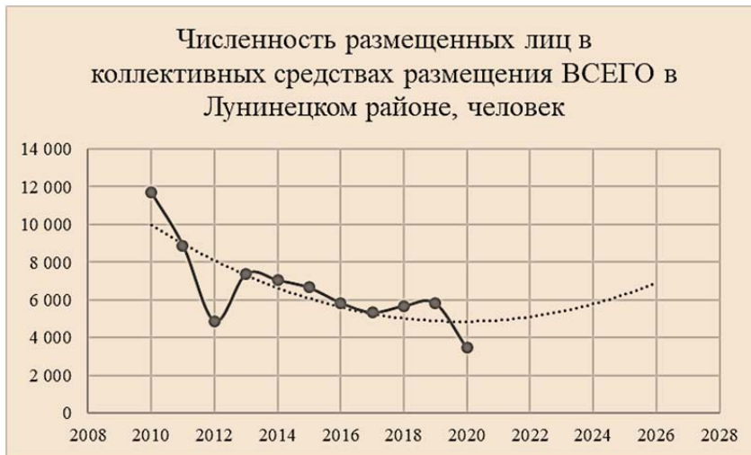
Рисунок 7. – Численность размещенных лиц в коллективных средствах размещения ВСЕГО в Лунинецком районе, человек

3. Скачки спроса, а также возможное его увеличение на коллективные средства размещения к 2026 году в Лунинецком районе может быть связано с недостаточно развитой инфраструктурой и рекламой данного региона, что подтверждается значительным снижением коэффициента загрузки в коллективных средствах размещения к 2026 году (рисунок 7).