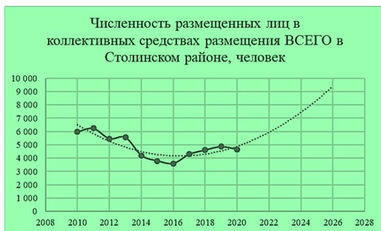
Рисунок 2. – Численность размещенных лиц в коллективных средствах размещения ВСЕГО в Столинском районе, человек

2. Увеличение же спроса на коллективные средства размещения к 2026 году в Столинском, Житковичском, Петриковском, Наровлянском и Мозырском районах обусловлен недостаточно развитой сетью индивидуальных средств размещения и их рекламы, однако коллективные средства размещения также используются при организации экотуристических маршрутов (рисунки 2 – 6).