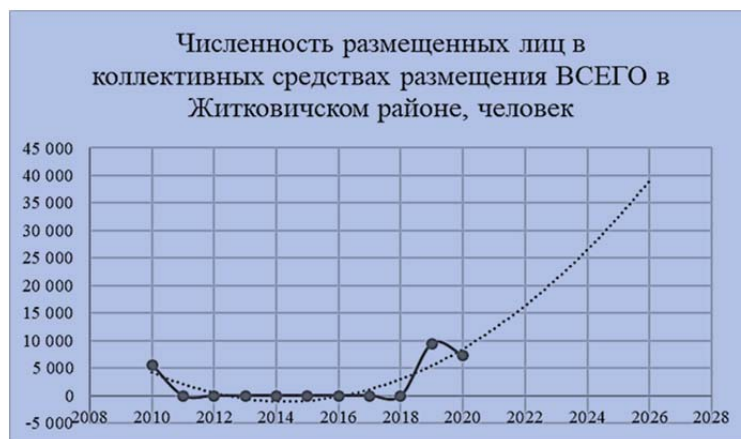
Рисунок 3. – Численность размещенных лиц в коллективных средствах размещения ВСЕГО в Житковичском районе, человек

Коэффициент же загрузки будет неодинаков в исследуемых регионах.