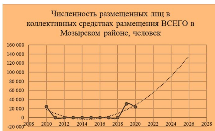
Рисунок 5. – Численность размещенных лиц в коллективных средствах размещения ВСЕГО в Мозырском районе, человек

В Столинском, Житковичском, Петриковском, Мозырском районах данный коэффициент также увеличиться, как и показатель численности.