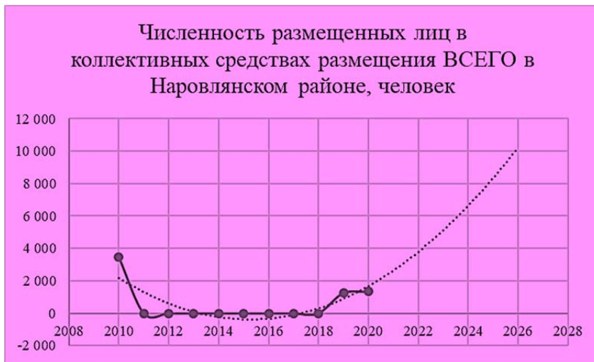
Рисунок 6. – Численность размещенных лиц в коллективных средствах размещения ВСЕГО в Наровлянском районе, человек

В Наровлянском же районе ожидается достаточно значительный спад по загрузке в связи с перераспределением турпотока на индивидуальные средства размещения, что также будет способствовать развитию экотуризма в регионе.