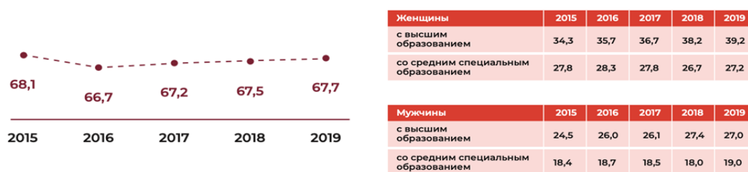
Рисунок 2. – Уровень занятости населения и занятое население по уровню образования

В Беларуси высокий уровень грамотности взрослого населения, высокий охват дошкольным, базовым, общим средним и профессиональным образованием, реализуется концепция непрерывного образования. В Рейтинге стран мира по Индексу образования Беларусь занимает 30 место со значением 0,837.