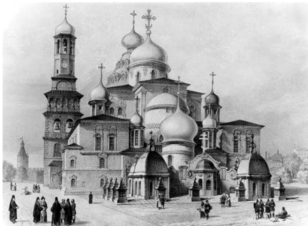
Воскресенский собор монастыря Нового Иерусалима: вид с востока

С 1710 г. в результате секуляризации земель за монастырем оставлены 3 вотчины, но с 1740 г. монастырь восстанавливает свое землевладение (по плану 1764 г. генерального межевания монастырю принадлежит 30 десятин земли).