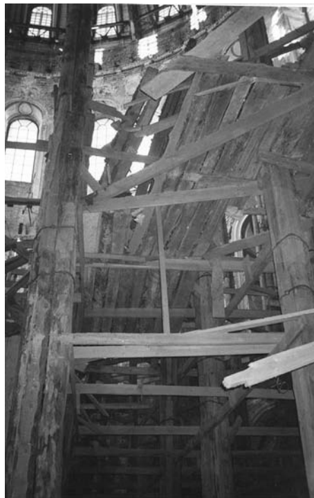
Строительные леса в ротонде собора