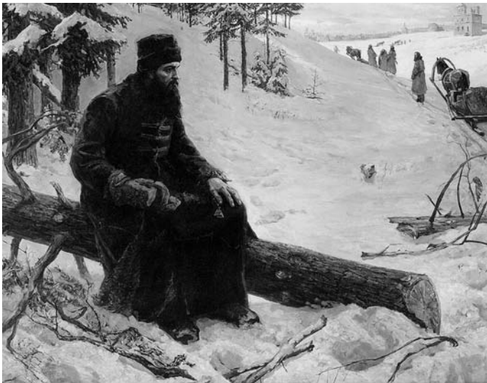
Строительство Нового Иерусалима Художник Б. Черушев. М., 1999

После осуждения и ссылки в 1666 г. Патриарха Никона в Ферапонтов, а затем в Кирилло-Белозерский монастыри Вологодской епархии Воскресенский монастырь было запрещено именовать новым Иерусалимом (вплоть до середины XVIII в.), всякое строительство в нем прекратилось. В период с 1666 по 1678 г. монастырь подвергается разорению: по распоряжению Патриарха Иоакима из монастыря вывозятся ценные книги, рукописи, святыни, мощи, личные вещи Святейшего Патриарха Никона, типографский станок и т.д.; отзываются в Москву строительных, изразцовых, литейных и иных дел мастера, прерываются строительные работы; за монастырем закрепляются лишь владения, сформированные до 1658 г.