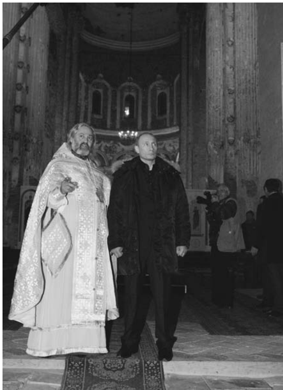
Визит Президента Российской Федерации В.В. Путина (Рождество Христово 7 января 2008 г.)