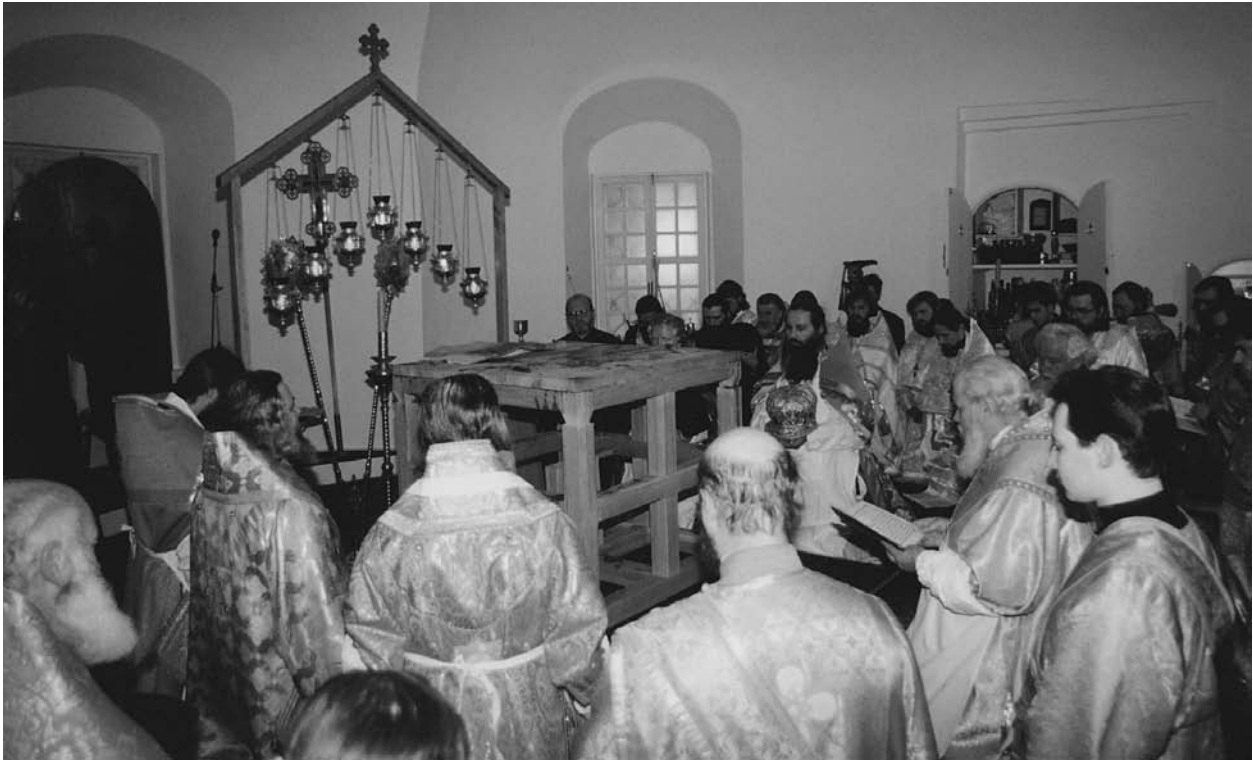
Освящение храма Рождества Христова в Трапезных палатах, декабрь 1997 г.