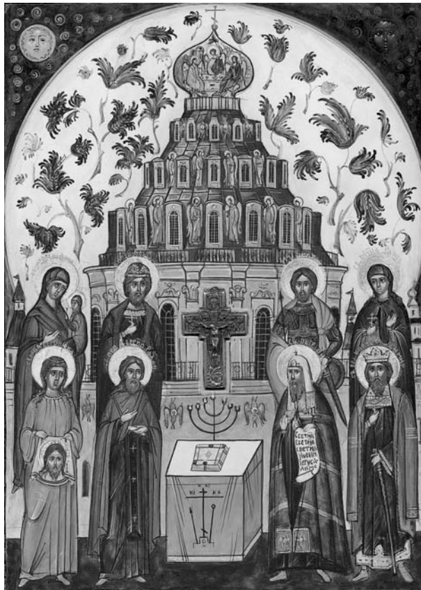
Новый Иерусалим: Патриарх Никон с предстоящими Иконография В. Шмидта. Иконописец Ю. Лукьянов, 2000

Не меньше для духовного возрождения России и единения православных народов сделал и может сделать Новый Иерусалим, восстановленный как великая святая христианского мира, как современный духовно-воспитательный, образовательный центр, призванный раскрыть всем, особенно молодежи, душеполезный смысл нетленных ценностей нашего Отечества».