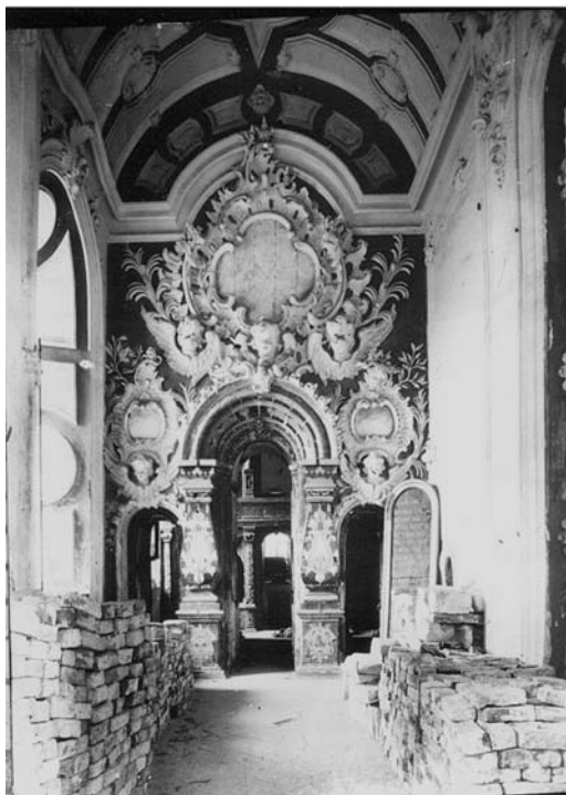
Успенский предел Воскресенского собора