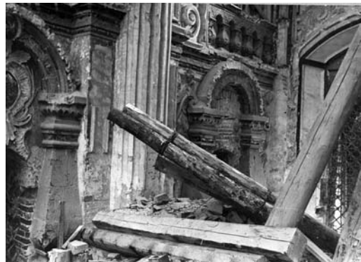
Руины кресто-купольной части Воскресенского собора