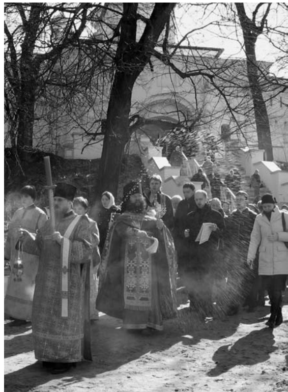
Пасха Христова, 2009 (Гефсимания; крестный ход на Иордан)