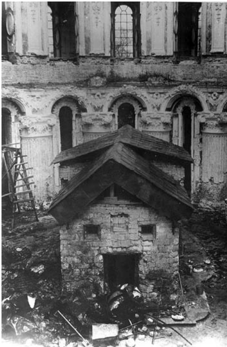
Палатка Гроба Господня