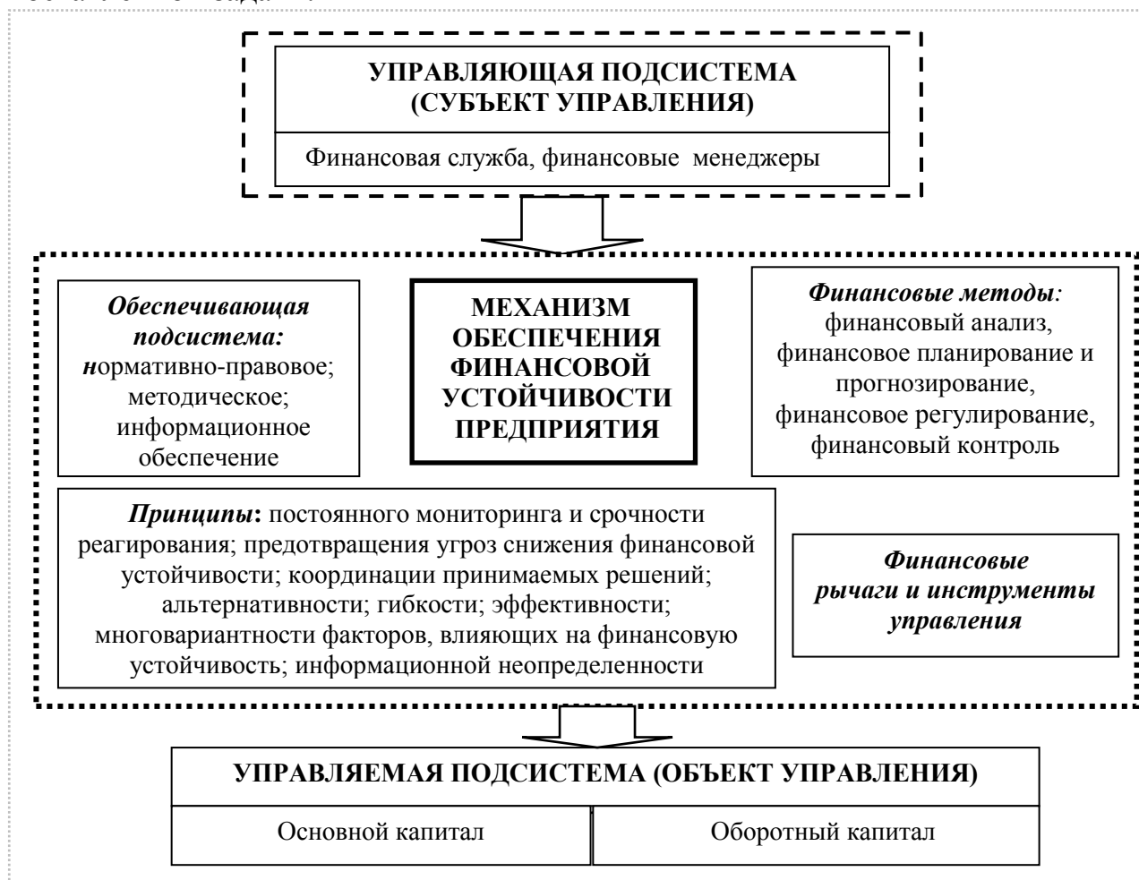
Рисунок 1. – Система обеспечения финансовой устойчивости организации

который будет направлено управленческое воздействие для достижения поставленной задачи.