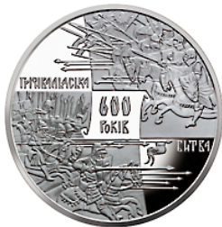
Реверс монеты «600 лет Грюнвальдской битвы» (2010)