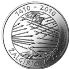
Реверс монеты «600 лет Грюнвальдской битвы» (номинал 1 литов) (2010)