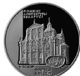
Реверс монеты «Фарный костёл. Несвиж» (2005)