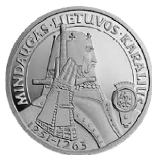
Реверс монеты «Миндовг» (1996)