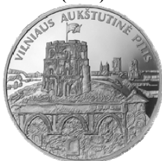
Реверс монеты «Верхний замок Вильнюса» (2011)