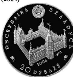
Аверс монеты «Софья Друцкая». 600 лет» (2006)