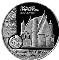
Реверс монеты «Церковь-крепость Сынковичи» (2000)