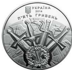
Аверс и реверс монеты «500-летие битвы под Оршей» (2014 г.)