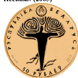
Аверс золотой монеты «Грюнвальдская битва. 600 лет» (2010)