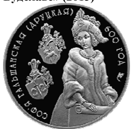
Реверс монеты «Софья Гольшанская (Друцкая). 600 лет» (2006)