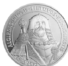
Реверс монеты «Ольгерд» (1998)