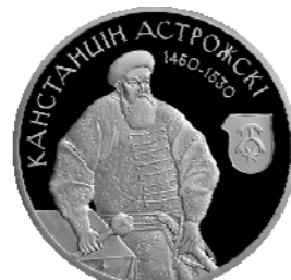
Реверс монеты «Константин Острожский» (2014)