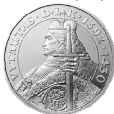
Реверс серебряной монеты «Витовт» (2000)