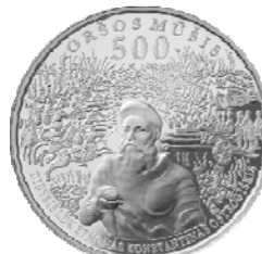
Реверс монеты «500 лет битве под Оршей» (2014)