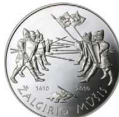
Реверс монеты «600 лет Грюнвальдской битвы» (номинал 50 литов) (2010)