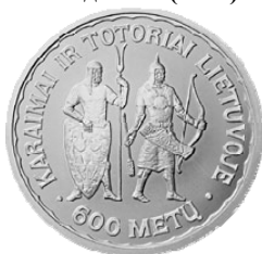
Реверс монеты «600 лет появления караймов и татар в Литве» (1997)