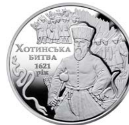
Реверс монеты «Хотинская битва» (2021)