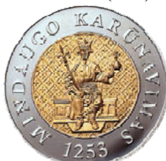
Реверс монеты «750 лет коронации Миндовга» (2003)