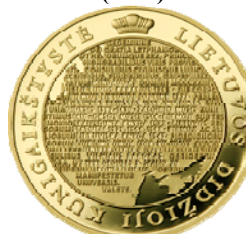
Реверс монеты «Великое Княжество Литовское» (2008)