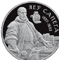
Реверс монеты «Лев Сапег» (2010)