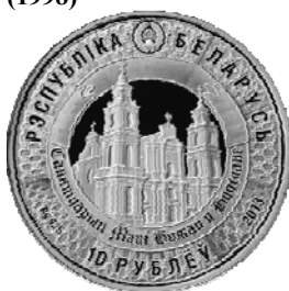
Аверс монеты «400 лет пребывания чудотворного образа Матери Божьей в Будславе» (2013)