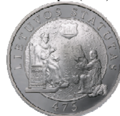
Реверс монеты «475 лет I Статуту ВКЛ» (2004)