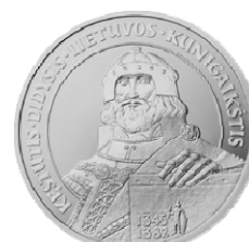
Реверс монеты «Кейстут» (1999)