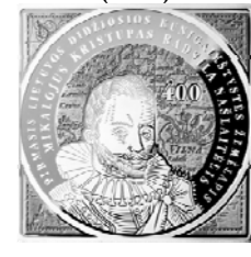
Реверс монеты «400 лет первой карты ВКЛ» (2013)