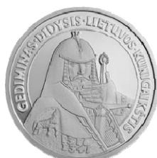
Реверс монеты «Гедимин» (1996)