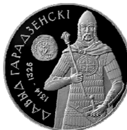
Реверс монеты «Давид Гродненский» (2008)