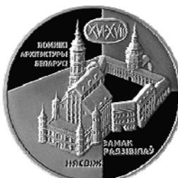
Реверс монеты «Замок Радзивиллов. Несвиж» (2004)