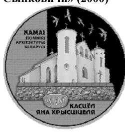
Реверс монеты «Костёл Иоанна Крестителя» (2014)