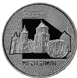
Реверс монеты «Мирский замок» (1998)