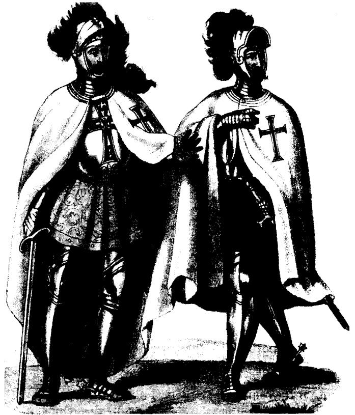
Рыцары Тэўтонскага ордэна.

комтур, яго бліжэйшы саветнік, а пры неабходнасці, намеснік вялікага магістра, кіраваў гаспадарчымі справамі і назіраў за паводзінамі братоў Ордэна і службыцелямі. Наступным у іерархіі Ордэна быў вялікі маршал у Кенігсбергу, які з'яўляўся намеснікам магістра ў якасці галоўнакамандуючага ваеннымі сіламі Ордэна. Ніжэй знаходзіліся вялікі шпітальнік, інтэндант, які заведваў вайсковай маёмасцю Ордэна, скарбнік і кашталян, які з'яўляўся начальнікам камтураў 55 .