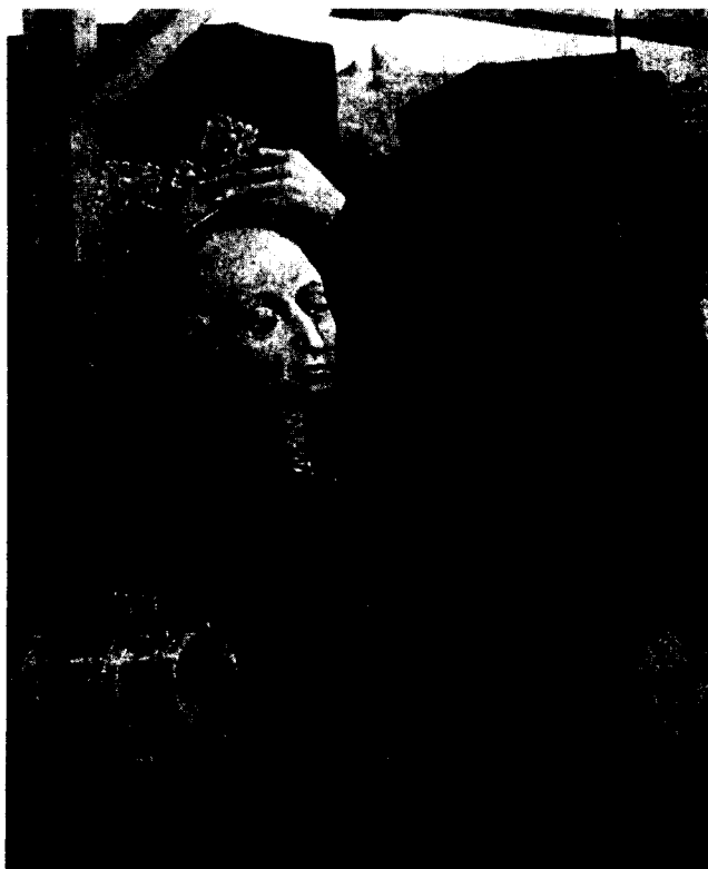
Польскі кароль Уладзіслаў Ягайла. Фрагмент фрэскі ў Кракаўскім замку Вавель. Канец XV ст.

Варта заўважыць, што крайняя жорсткасць з'яўлялася неад'емнай часткай вайсковых выпраў таго часу. Польска-літоўскія войскі не былі выключэннем і мала адрозніваліся ў гэтым плане ад крыжакоў. У населеных пунктах, якія захопліваліся і падлягалі рабаванню, мужчын часта знішчалі, а жанчын гвалцілі. Паводле Я. Длугаша, "літоўцы і татары спусташалі гэту вобласць як варожую, з варварскай жорсткасцю, забіваючы не толькі дарослых, але і юнакоў і нават немаўлятак, якія плакалі ў калысках. Іншых разам з маткамі яны прымусова бралі ў палон, у свае наметы, як ворагаў і іншаземцаў, хоць жыхары гэтай