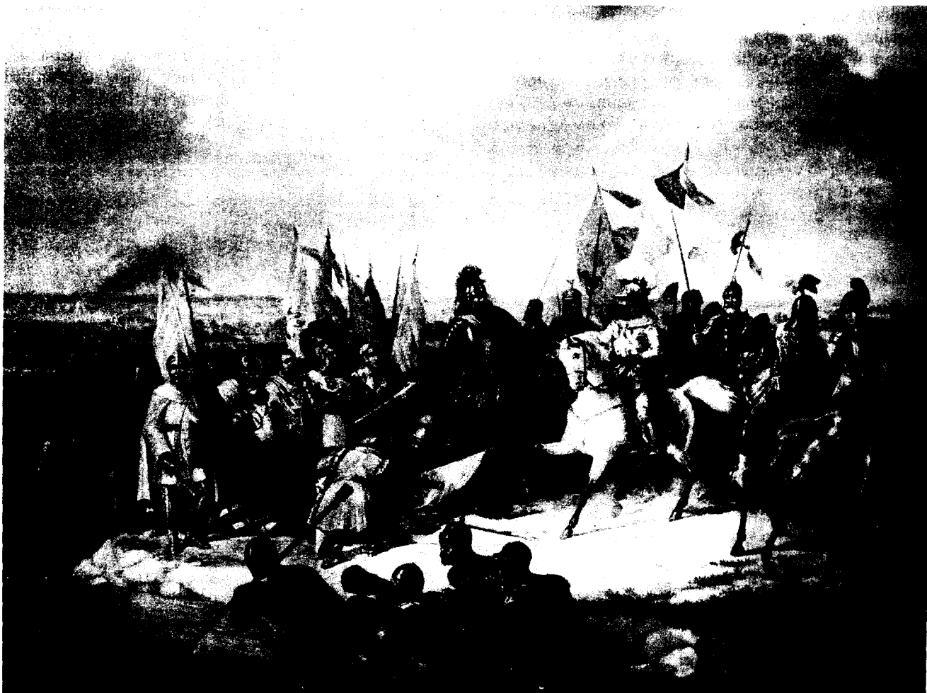
Я.Суходольскі. Пасля Грунвальдскай бітвы. Першая палова XIX ст.

Тэўтонскі ордэн павінен быў выплаціць Ягайлу ў тры тэрміны (24 чэрвеня, 29 верасня і 11 лістапада) сто тысяч коп шырокіх пражскіх грошаў (6 000 000 грошаў). Жамойць заставалася ў складзе ВКЛ, але пасля смерці Ягайлы і Вітаўта павінна была перайсці да Ордэна 83 . Добжыньская зямля заставалася ў Польшчы, Памор'і, Міхалоўская і Хелмскае землі — у крыжакоў. Пытанне аб спрэчных памежных замках Сантоке і Дрэздэнке перадаваліся на разгляд камісіі з 12 чалавек, абраных каралём і магістрам, ці на суд папы рымскага 84 .