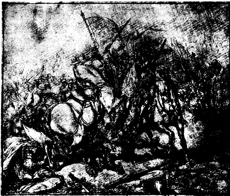
Бітва пад Грунвальдам. Малюнак Ю.Косака.

Агульную лічбу загінуўшых як з польска-літоўскага, так і з крыжацкага боку падлічыць немагчыма. Верагодна, страты склалі не менш чым па некалькі тысяч забітых у абодвух арміях — толькі Эльблонг страціў 550 чалавек 76 . Аднак у крыжакоў страты па-