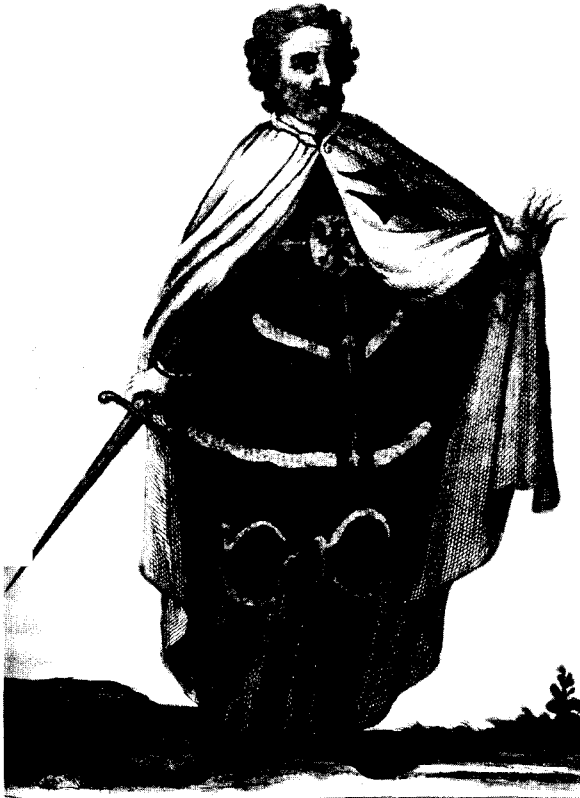
Вялікі магістр Тэўтонскага ордэна.