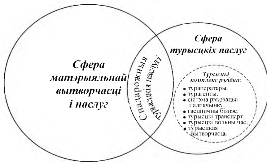
Мал. 1. Структура сферы турыцкіх паслуг у эканоміцы рэгіёна

Выяўленая шматфункцыянальнасць дазволіла прадставіць сферу турыцкіх паслуг як сукупнасць галін, якія прама або ўскосна задавальняюць патрэбнасці грамадства ў турызме. Такім чынам, роля турызму ў сацыяльна-эканамічным развіцці рэгіёна вызначае выразную структуру ўзаемадзеяння сферы турыцкіх паслуг з іншымі галінамі эканомікі, а таксама месца рэгіянальнага турысцкага комплексу ў гэтай сістэме (мал. 1).