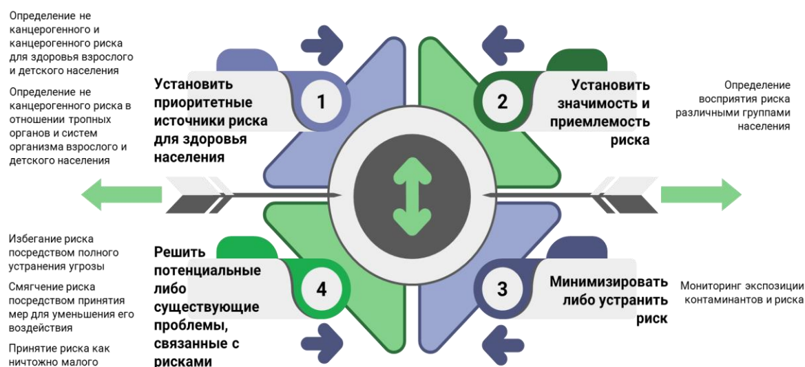
Рис. 3. Стратегия управления не канцерогенным и канцерогенным риском для населения от потребления картофеля, выращиваемого в пределах агроселитебных ландшафтов г. Горки

оценка и ранжирование риска; определение уровней приемлемости риска; снижение и контроль риска; реагирование на риск, предусматривающее его избегание, смягчение либо принятие (рис. 3).