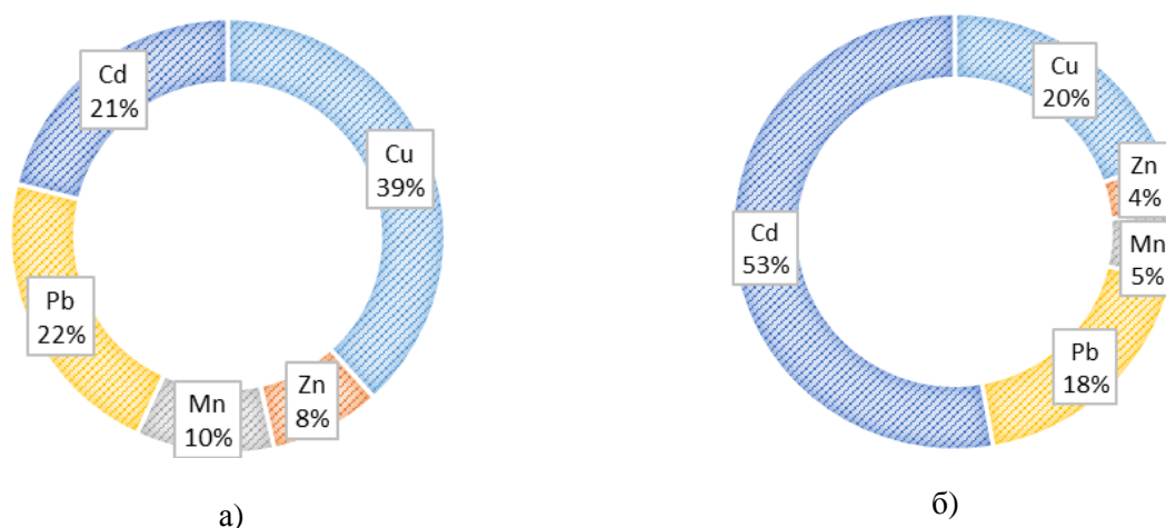
Рис. 1. Вклад отдельных тяжелых металлов, поступающих в организм взрослого и детского населения вследствие употребления в пищу картофеля, выращиваемого в пределах агроселитебных ландшафтов г. Горки, в общее значение суммарного индекса опасности НИ (а – уровень медианы; б – уровень 90-го перцентиля)

В разрезе отдельных элементов ни на уровне медианы, ни на уровне 90-го перцентиля коэффициент опасности для взрослого населения не превышал допустимого значения, что свидетельствует об относительной безопасности употребления картофеля в случае его моноэлементного загрязнения. Для детского населения HQ содержания кадмия, меди и свинца в картофеле превышал 1,0 на уровне 90-го перцентиля. Данный факт свидетельствует о том, что при употреблении в пищу картофеля воздействие на организм детей присутствующих в нем Cd, Cu и Pb характеризуется как недопустимое. Суммарный индекс опасности возникновения неканцерогенных эффектов вследствие воздействия тяжелых металлов для детского населения оценивается как средний на уровне медианы и как чрезвычайно высокий – на уровне 90-го перцентиля.