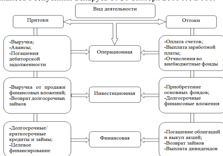
Рисунок 2. – Денежные потоки организации по видам хозяйственной деятельности

Основным документом, используемым в качестве базы для изучения денежных потоков организации, является “Отчет о движении денежных средств” (форма 4), утвержденный постановлением Министерства финансов Республики Беларусь от 31 октября 2011 г. № 111.