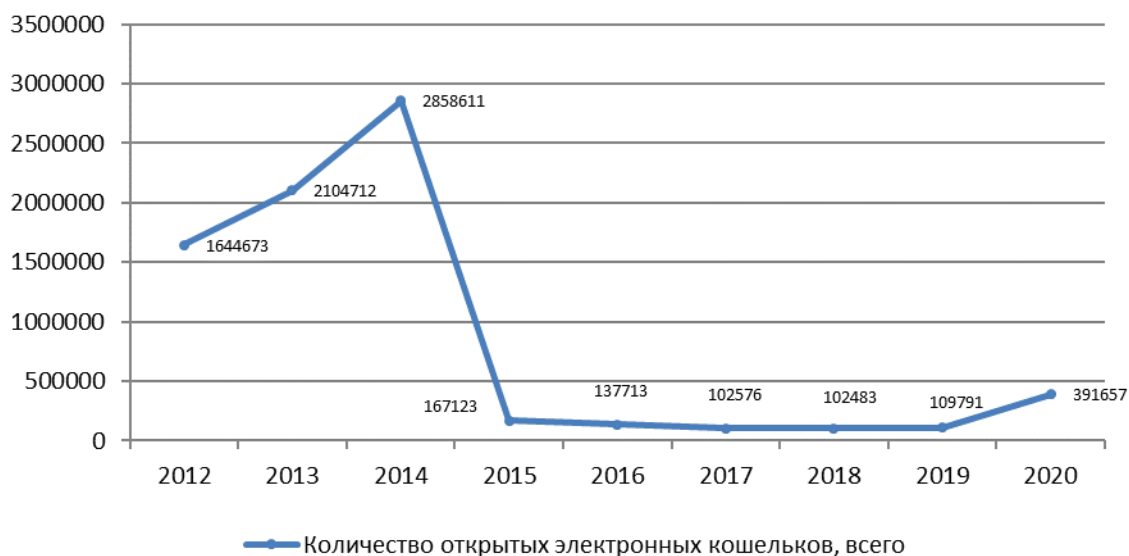
Рисунок – Динамика количества открытых электронных кошельков в Республике Беларусь за период 2012-2020 гг., ед.

В 2015 г. интерес населения к использованию электронных денег значительно сократился, что в некоторой степени обусловлено необходимостью прохождения в большинстве случаев процедуры идентификации владельцев электронных кошельков. Она стала обязательной с момента вступления в действие Декрета Президента Республики Беларусь от 28 декабря 2014 г. № 6 "О неотложных мерах по противодействию незаконному обороту наркотиков". В отдельных случаях данную процедуру возможно осуществить дистанционно в случае наличия счета в банке-эмитенте или идентификационных сведений о физическом лице в МСИ (рисунок).