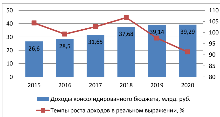
Рисунок 1. – Динамика доходов консолидированного бюджета в номинальном и реальном выражении за 2015-2020 гг.

Примечание – собственная разработка на основе [4].