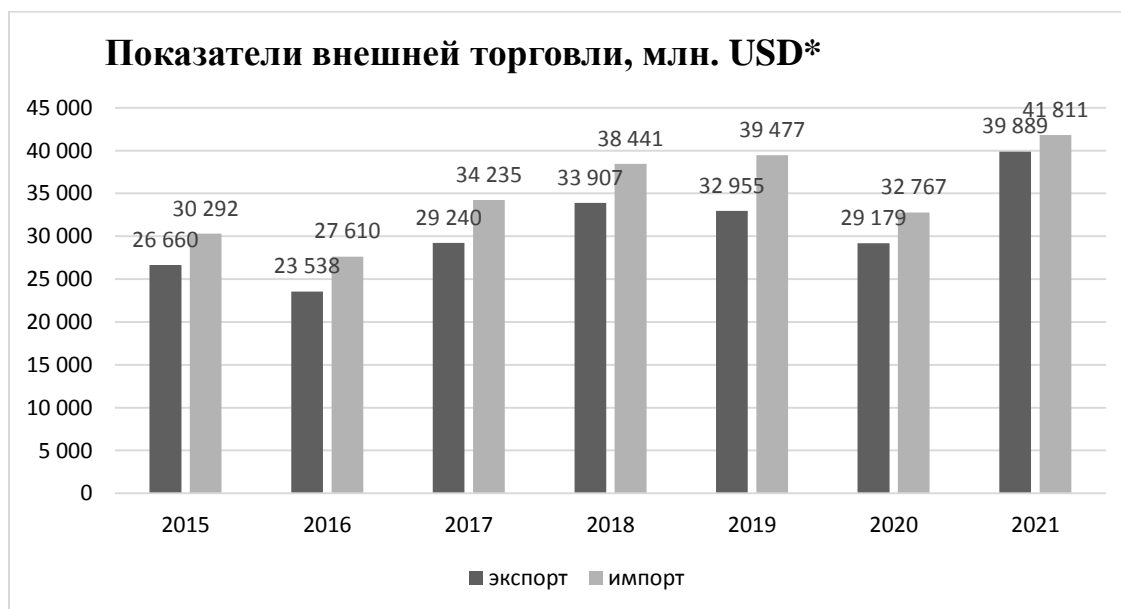
Рисунок 2. – Основные показатели внешней торговли в 2015-2021 годах

По оценкам экспертов Европейского банка реконструкции и развития в 2022 году прогнозирует небольшой спад ВВП на уровне 8%. ЕБРР констатировал ухудшение деловой среды в Беларуси в связи с продолжающимися массовыми протестами после президентских выборов, которые прошли в августе 2020. В связи с данными событиями ЕБРР выделяет угрозу для IT-сектора страны, который оставался основным источником роста экономики в первой половине 2020 года, компенсируя ухудшение ситуации в перерабатывающей промышленности из-за пандемии коронавируса.