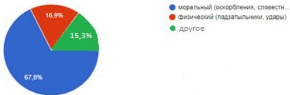
Рисунок 2. – Виды буллинга

По результатам ответов на вопрос «Какой вид буллинга вас задевает больше всего?» (рис. 2), мы видим, что моральный буллинг преобладает в этих ответах. Из этого следует сделать вывод, что подростки больше боятся получить моральные оскорбления, чем физическое причинение боли. Этому есть несложное объяснение: моральное унижение несет больший ущерб самооценке подростка.